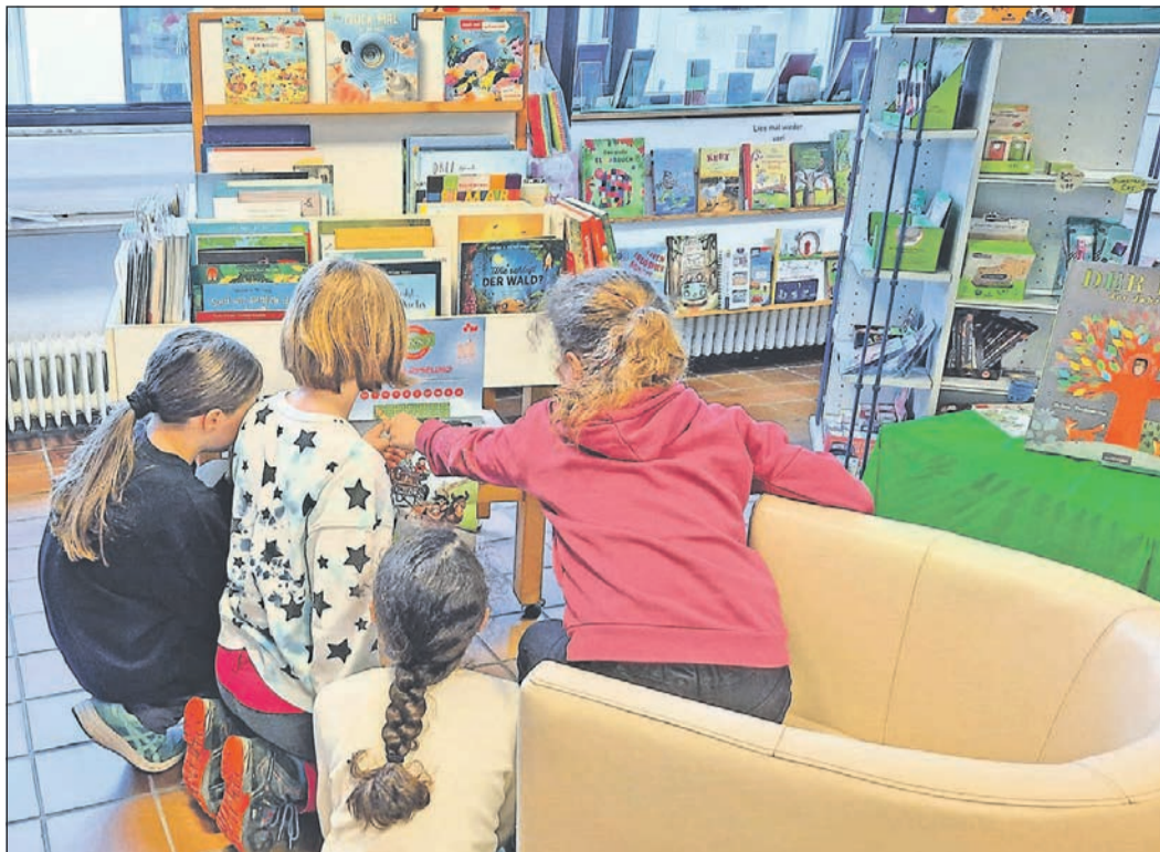
Auch die jungen Leser der Geschwister-Scholl-Schule finden in der Lesecke des „7. Himmels“ viele interessante Bücher.