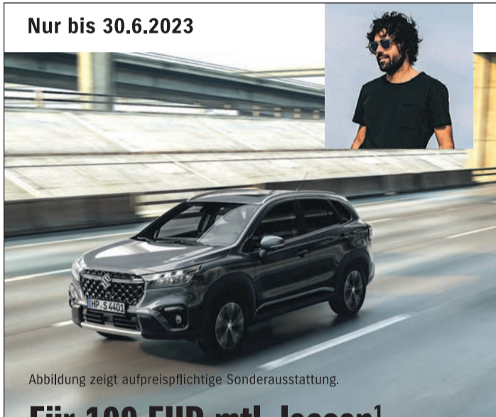
Abbildung zeigt aufpreispflichtige Sonderausstattung.