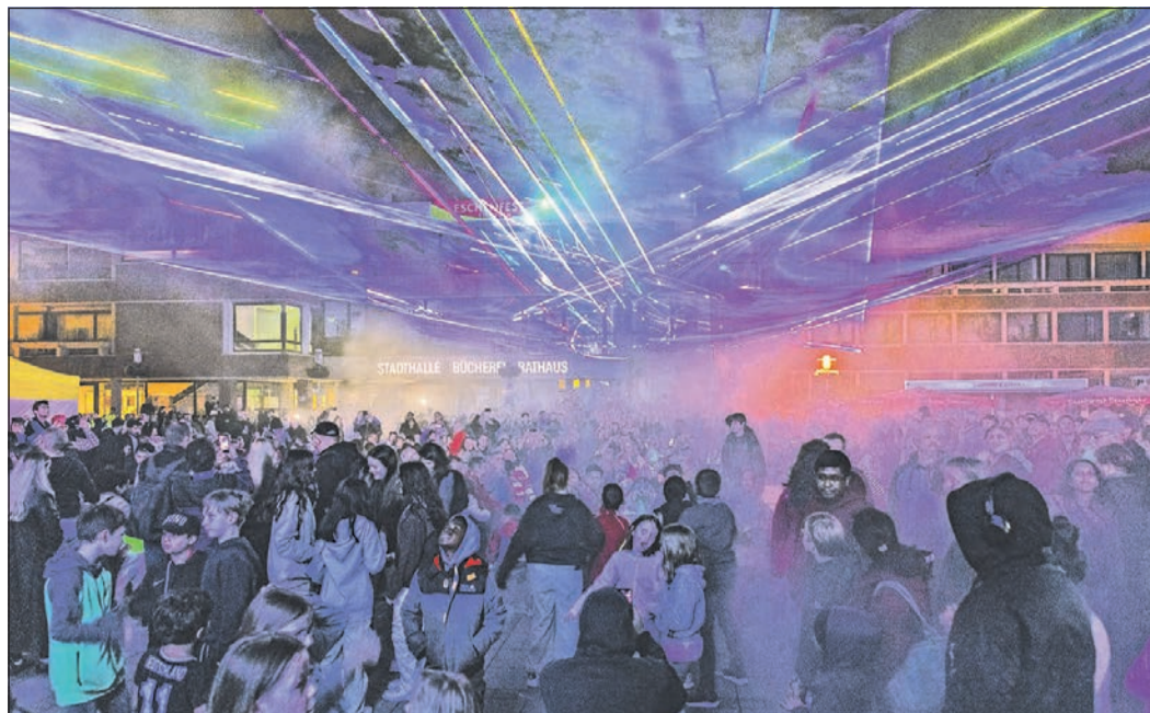
Die Lasershow beim Eschenfest begeistert Alt und Jung.

Um frühzeitig an die „Girls'-Day“- und „Boys'-Day“-Angebote der Stadt Eschborn erinnert zu werden, können Interessierte eine E-Mail an gleichstellung@eschborn.de schreiben.