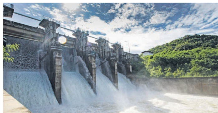
Die steigende Nachfrage nach grünem Strom wird auch mit Wasserkraft aus Skandinavien gedeckt.