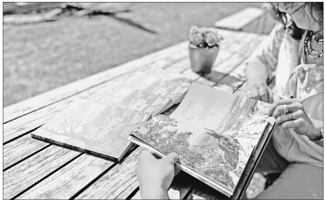
Auf knapp 100 Seiten begeben sich Leser im neuen Magazin auf eine Reise quer durch den Taunus.

Nähere Auskünfte zu der Tätigkeit gibt es auf der Homepage des Bundes Deutscher Schiedsmänner und Schiedsfrauen www.schiedsamt.de .