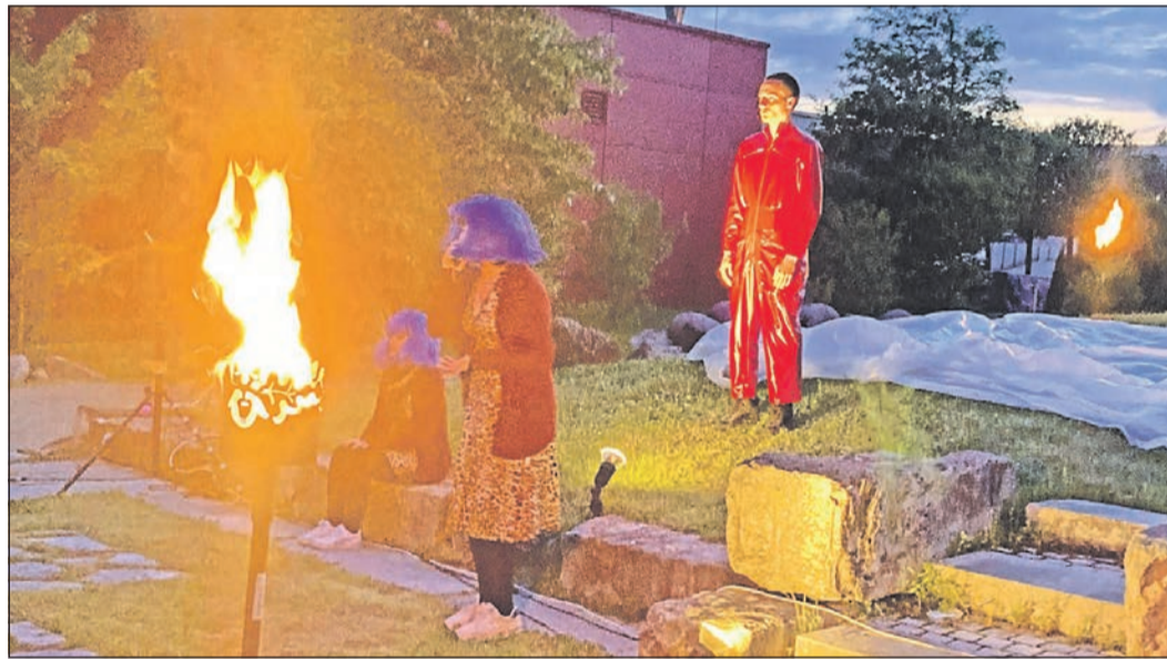
Mit zwei wunderbaren Theaterabenden unterhalten HvK-Schüler ihr Publikum im Vespertag.

wie sonst üblich im kleinen Kleist-Forum der HvK aufgeführt. Die jungen Schauspieler hatten das Publikum ins Vespertag der Firma Depping eingeladen und spielten dort unter freiem Himmel auf verschiedenen kleinen Bühnen. Auch die neu angeschaffte Drehbühne der HvK kam zum Einsatz. Für den technischen Support sorgten dank der großzügigen Unterstützung des Kulturamts der Stadt Eschborn Olaf Beranek und sein Team. Vor und nach den Aufführungen wurden die Gäste von der Firma Walch-Catering mit Speisen und Getränken verwöhnt. Und auch das Wetter spielte in diesen von einer eher unsicheren Wetterlage bestimmten Frühlingstagen mit. Schirme und warme Decken wurden nicht gebraucht. Über der Aufführung am Freitag leuchtete sogar ein wunderschöner Frühlingsvollmond.