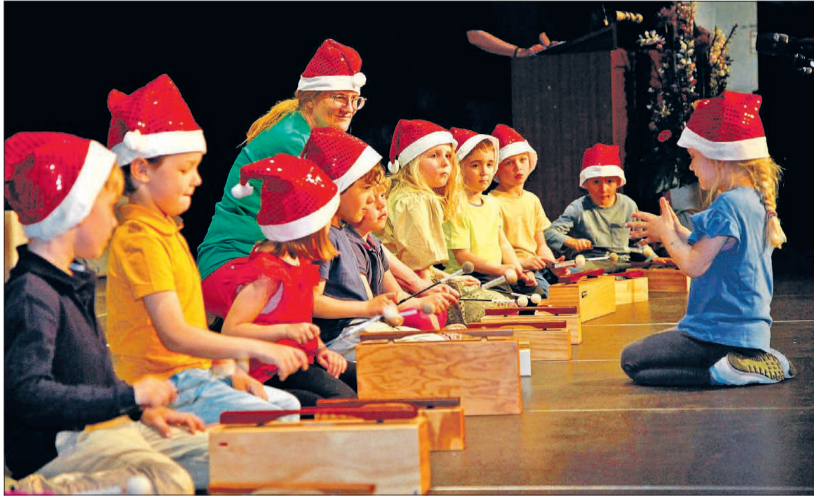
Beim Kinderkonzert der Musikschule Taunus reisen 70 Vier- bis Sechsjährige musikalisch durch die vier Elemente und laden zum Mitmachen ein. „Auf der Erde“ hüpfen und springen die Zwerge mit ihren roten Zipfelmützen umher.