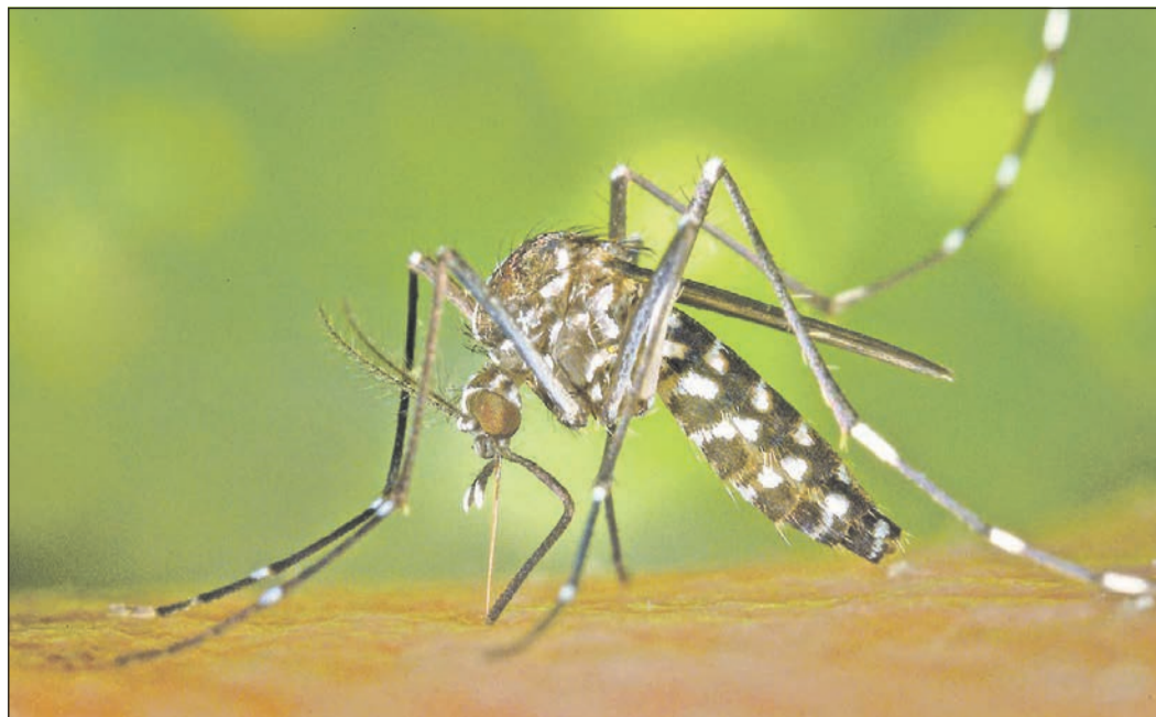
Die Tigermücke kann exotische Krankheitserreger übertragen.