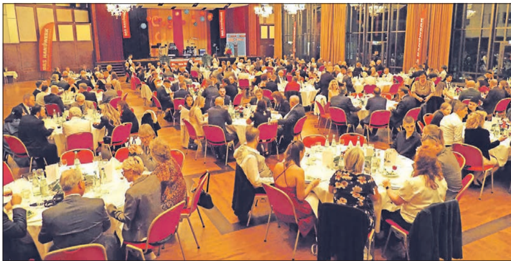
240 Gäste, darunter viele prominente Vertreter aus Wirtschaft, Politik und Verwaltung, haben im Saal des Bad Homburger Kurhauses Platz genommen.