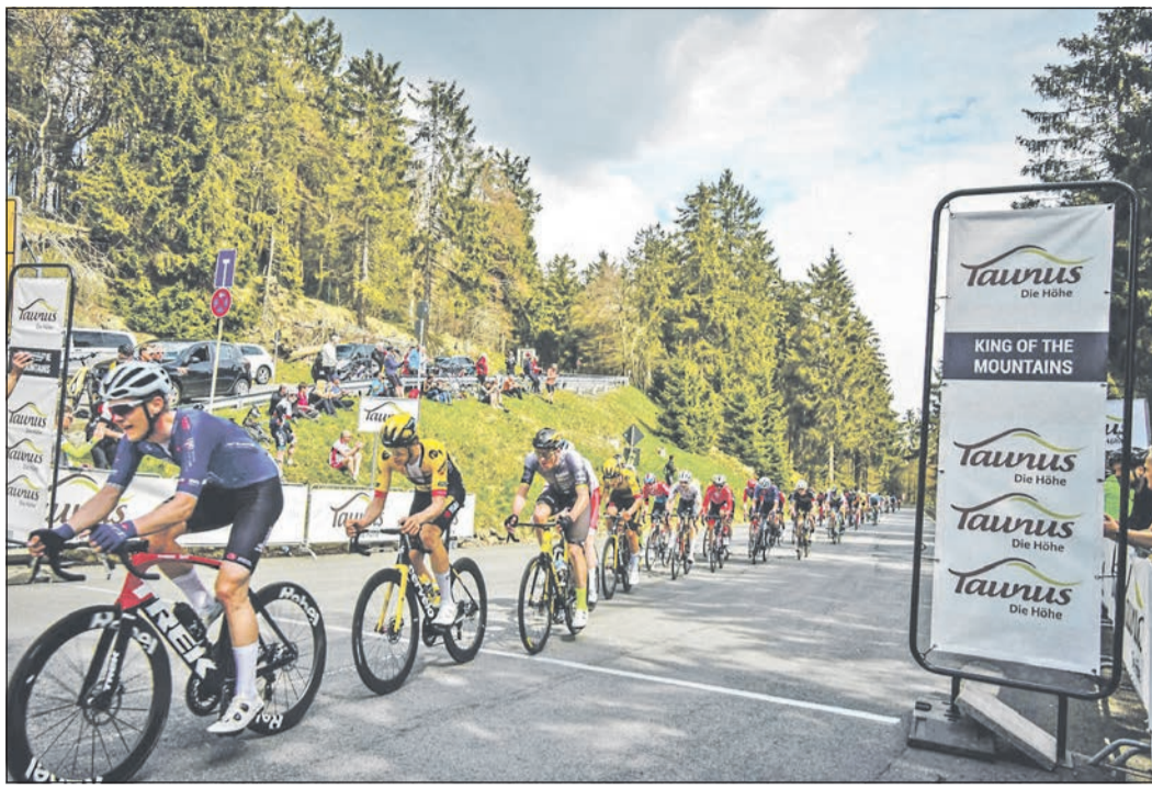
Mehr Kilometer und Höhenmeter haben die Profi-Teilnehmer beim diesjährigen Radklassiker Eschborn-Frankfurt absolviert. Dies soll im kommenden Jahr auch für den Radsport-Nachwuchs gelten.