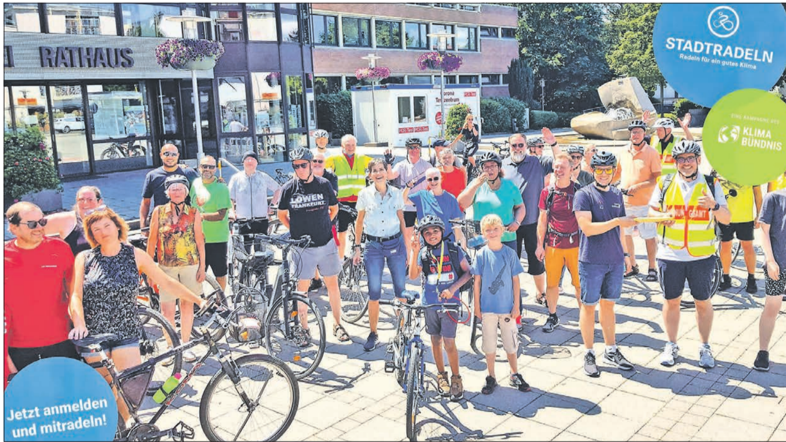
Start zur Auftakttour des „Stadtradelns“ mit zahlreichen Radlern am Rathausplatz im vergangenen Jahr.

Eschborner Woche unter taunus-nachrichten.de ... und zusätzliche Artikel im Internet