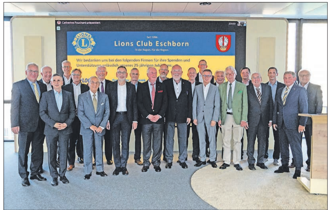
Viele Teilnehmer sind gekommen, um dem Lions Club in Eschborn zum 25-jährigen Bestehen zu gratulieren.