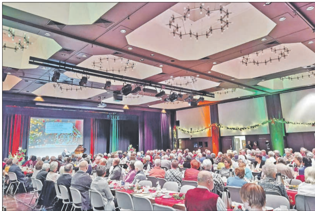
Beim Adventsnachmittag in der Stadthalle Eschborn feiern die Senioren bei festlicher Stimmung.

Bei den im Anschluss stattfindenden Gesprächen betonten einige Gäste gegenüber dem Seniorendezernten, dass sie dieses Weihnachtskonzert in solcher Form großartig fanden und sich schon jetzt auf das nächste Weihnachtskonzert im Jahr 2024 freuen.