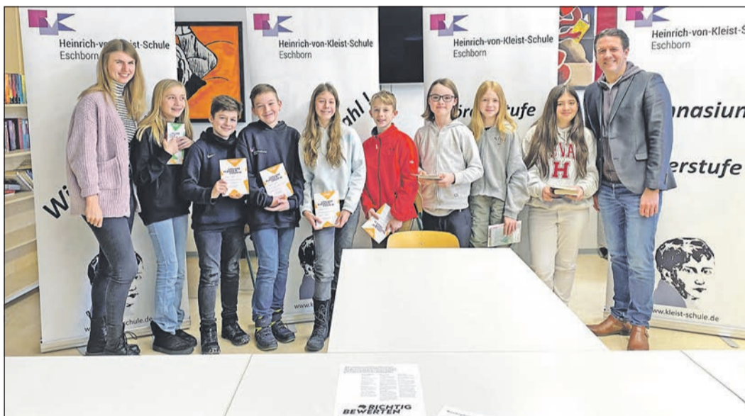
Die diesjährigen Klassensieger des Vorlesewettbewerbes.

Weitere Informationen rund um die Heinrich-von-Kleist-Schule sind unter Telefon 06196-95700 oder unter www.kleist-schule.de erhältlich.