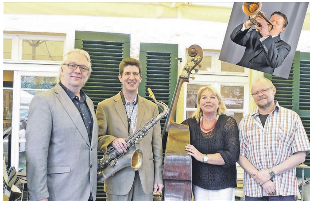
Die fünf Musiker von „Born to Swing“.

Roman-Debüt „Ich bin die, vor der mich meine Mutter gewarnt hat“ einen Erfolg gelandet und den Schweizer Literaturpreis gewonnen. Wie der Autor auf die ungewöhnliche Geschichte der „Mr. Goebbels Jazz Band“ gestoßen ist und welche Rolle Jazz in seinem Leben spielt, erzählt er spannend und eindrucksvoll in seiner Lesung. Die Veranstaltung findet im Rahmen des Literaturfestivals „Leseland Hessen“ statt, mit freundlicher Unterstützung des Hessischen Ministeriums für Wissenschaft und Kunst, der Sparkassen-Kulturstiftung Hessen-Thüringen sowie hr2-kultur. Die Lesung am Dienstag, 19. September, im Bürgerhaus Schwalbach beginnt um 19.30 Uhr. Die Karten kosten fünf Euro und sind im Vorverkauf über den Kulturkreis und in der Stadtbücherei sowie an der Abendkasse erhältlich.