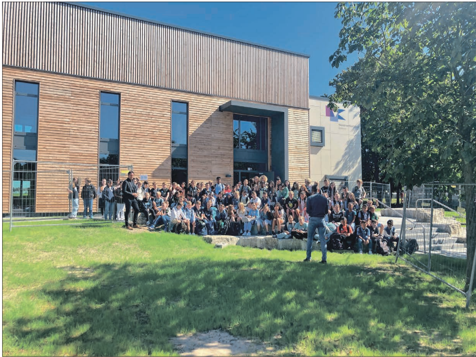
Der Neubau an der Heinrich-von-Kleist-Schule kommt nicht nur bei den neuen Fünftklässlern sehr gut an, die sich an ihrem ersten Schultag an der weiterführenden Schule dort versammelt haben.