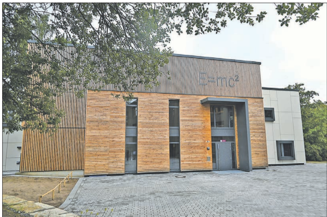
Bei der Baustellenrundfahrt zu verschiedenen Projekten wie hier dem Erweiterungsbau der Albert-Einstein-Schule machen sich die Verantwortlichen des Main-Taunus-Kreises ein Bild vom Baufortschritt.