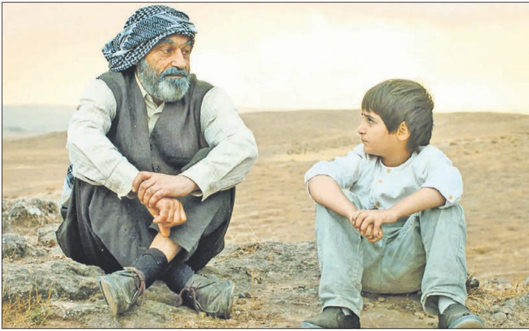
Das Eschborn K zeigt den sehenswerten Film „Nachbarn“ – eine Kindheit im Syrien der 80er-Jahre.