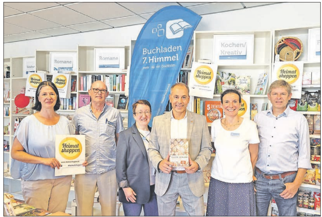
Der Buchladen „7. Himmel“ hat an der Aktion „Heimat shoppen“ teilgenommen und begrüßt Bürgermeister Adnan Shaikh (3. v. r.), der anlässlich der Aktion bei einem ausgewählten Rundgang gemeinsam mit der Wirtschaftsförderung verschiedene Geschäfte besucht hat. Foto: Stadt Eschborn

Für Donnerstag, 28. September, um 15.30 Uhr lädt die Stadt Eschborn alle, die gerne tanzen und einen geselligen Nachmittag verbringen möchten, zu einem zünftigen Oktoberfest ins Bürgerzentrum Niederhöchstadt ein. Die Gäste erwartet eine Riesenstimmung mit den „Original Taunusmusikanten“: Ob in Lederhose oder in Trachtenweste, die „Original Taunusmusikanten“ sind einfach sympathische Vertreter der deutschsprachigen Volksmusik. Die einzigartige Mischung der Lieder lässt den Nachmittag zu einem unvergesslichen Erlebnis werden und so wird zu schmissiger Musik gesungen, geschunkelt und gelacht. Für das leibliche Wohl wird bestens gesorgt, es gibt Zwiebelkuchen oder Streuselkuchen. Personen, die eine Transportmöglichkeit benötigen, können sich unter Telefon 06196-490266 bei Frau Worgull informieren. Der Eintritt ist frei. Foto: Stadt Eschborn