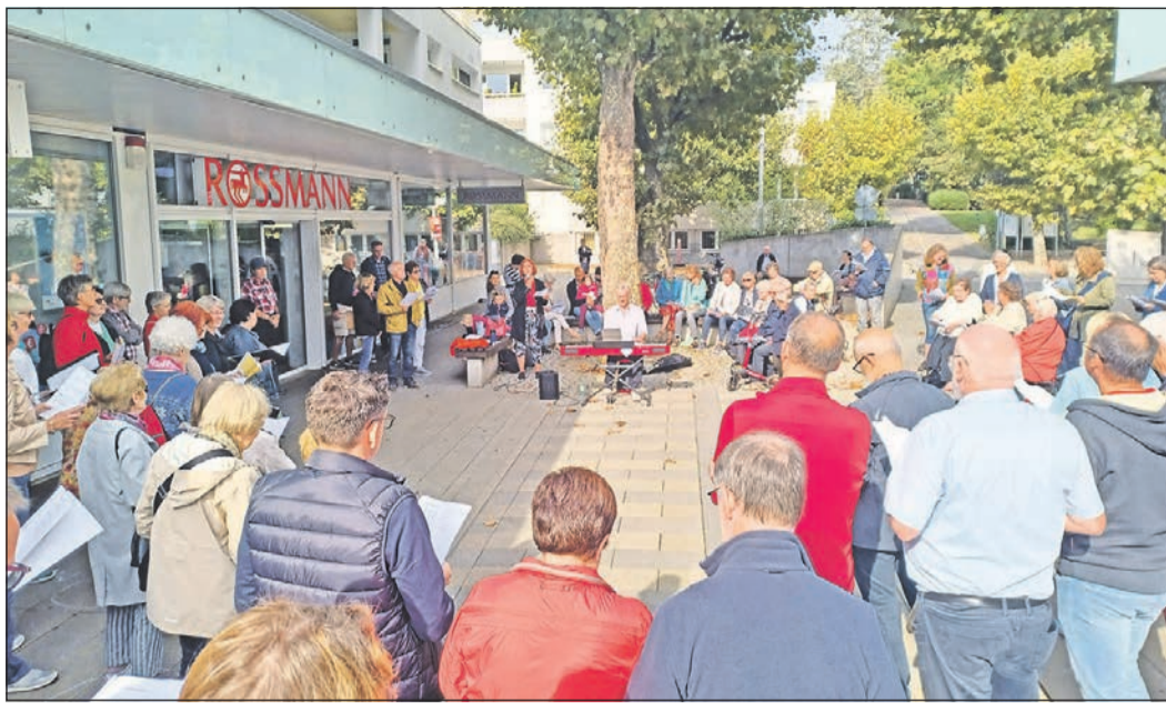
Gut 100 Schwalbacher singen gemeinsam mit etwa 30 Chormitgliedern von „Pro Musica Schwalbach“ am Tag der Deutschen Einheit Lieder von Frieden, Freiheit und Hoffnung.