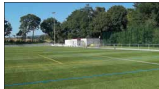
Der Waldsportplatz in Altenhain

Eigentümerin des Sportplatzes am Waldrand ist die Stadt Bad Soden am Taunus, genutzt wird die Anlage in erster Linie vom BSC