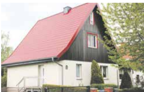
Rundum gut bedacht? Mit Metalldachpfannen von LUXMETALL sind wir bei der Dachsanierung auf der sicheren Seite.

(epr) Dass wir uns gut geschützt fühlen, hat insbesondere in den eigenen vier Wänden einen enormen Stellenwert – und zwar nicht nur vor Langfingern. Auch die Wetterbeständigkeit sowie Wohngesundheit von Baustoffen spielen in Sachen Sicherheit eine immer wichtigere Rolle. Das gilt vor allem für das Dach. Nur wenn es intakt ist, kann es uns buchstäblich „von oben herab“ ein beruhigendes Gefühl vermitteln. Bei der Sanierung von Bitumendächern etwa befinden wir uns mit Metalldachpfannen von LUXMETALL auf der sicheren Seite. Denn die Pfannen sind nicht nur sehr leicht, was die gesamte Baukonstruktion entlastet und eine schnelle Dachauf-Dach-Lösung ermöglicht. Sie sind auch überaus robust, widerstandsfähig und langlebig – gera-