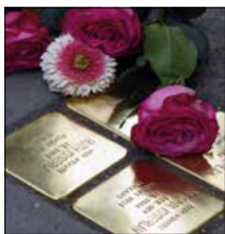
Den Opfern wieder einen Namen geben: Stolpersteine in Bad Soden. Die „Arbeitsgemeinschaft Stolpersteine“ lädt zu einer Ausstellung ein.

Bad Soden (bs) – Die Arbeitsgemeinschaft (AG) Stolpersteine in Bad Soden besteht seit zehn Jahren, gegründet wurde sie im August 2013. Nun lädt die AG unter der Überschrift „Gegen das Vergessen“ zu einer Ausstellung in das Kunstkabinett im Kulturzentrum Badehaus in Bad Soden ein. Die Ausstellung wird am Samstag, 21. Oktober, um 16 Uhr im Kunstkabinett eröffnet.