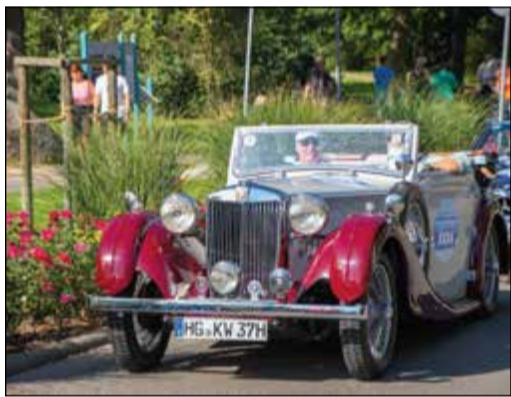
Das älteste Fahrzeug bei der Main-Taunus-Rallye war ein MG VA Drophead Coupe aus dem Jahr 1937.

Main-Taunus-Kreis (bs) – Fast 120 Fahrzeuge haben an der diesjährigen Oldtimer-Rallye „Main-Taunus Klassik“ teilgenommen. Wie Landrat Michael Cyriax mitteilt, geht auch der diesjährige Erlös an die Main-Taunus-Stiftung, die unverschuldet in Not geratenen Menschen möglichst unbürokratisch und schnell helfen will. „Dieser Tag war ein großer Erfolg nicht nur für die Stiftung, sondern bot auch Teilnehmern wie Publikum ein tolles Erlebnis“, fasst Cyriax zusammen, der