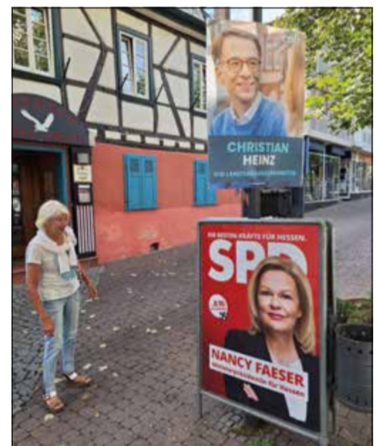
Unübersehbar: Wahlplakate in der Stadt

der These vom Lehrermangel entgegen. Die Schülerzahlen seien stark gestiegen, was so aber nicht prognostiziert worden sei. So seien zuletzt rund 20.000 ukrainische Kinder an hessischen Schulen aufgenommen worden. Nicht thematisiert wurde bedauerlicherweise die Diskussion um Schulnoten, die derzeit in Hessen kontrovers geführt wird. Die FDP hat dabei im Wahlkampf unterstrichen, dass die Notenvergabe an den Schulen spätestens