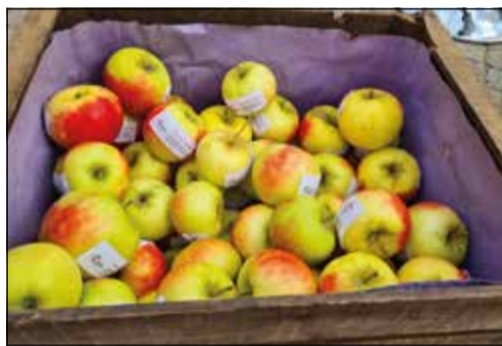
Äpfel aus Neuenhain

Neuenhain (bs) – Zum 28. Mal hat am vergangenen Samstag der Herbstmarkt im Ortskern von Neuenhain stattgefunden und zum Schauen, Probieren und Genießen eingeladen. Ortsansässige Gewerbetreibende hatten ihre Geschäfte geöffnet, „fliegende Händler“, Vereine und Hobbybastler boten ihre Waren an. Frische, regionale Produkte wie heimische