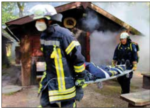
So geht es: Rettung aus einer Hütte