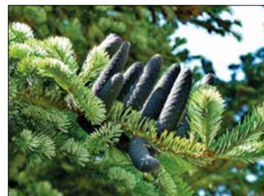
Zapfen der Korea-Tanne im Arboretum

Treffpunkt: 14 Uhr am Waldhaus im Arboretum Main-Taunus, Am Weißen Stein, 65824 Schwalbach. Teilnehmerbeitrag: Erwachsene fünf, Kinder zwei Euro.