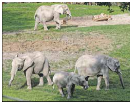
Zusammenführung der Elefantenkühe Lilak (im Hintergrund) und Kariba (links) mit Cristina (rechts) und Jungtier Neco (im Vordergrund)

Kronberg/Bad Soden (bs) – Im Opel-Zoo ist die Eingewöhnung der beiden Elefanten-Neuzugänge aus Spanien nun weiter vorangeschritten: Jetzt kamen erstmals Cristina und ihr zweieinhalbjähriger Sohn Neco mit Kariba auf der großen Außenanlage zusammen und gewöhnten sich recht schnell aneinander. Bald schon suchten sie gemeinsam die Schlamm- und Sandsuhlen auf und widmeten sich ausgiebig der Körperpflege – „Typisch