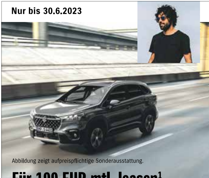
Abbildung zeigt aufpreispflichtige Sonderausstattung.