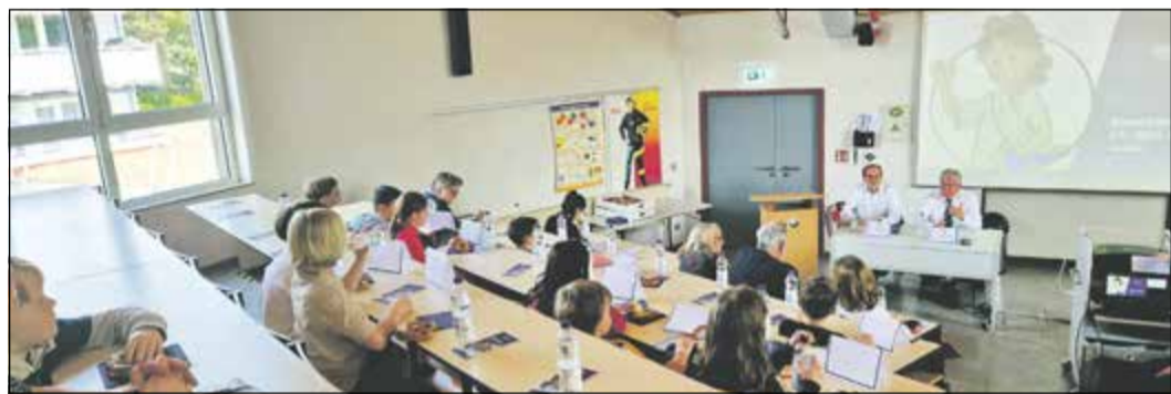
Ein ganz besonderes Parlament: Politik für Kinder erlebbar machen.

Bad Soden (bs) – In der vergangenen Woche hat das Kinderparlament der Bad Sodener Grundschulen in der Feuerwache getagt. Rund 44 Kinder der dritten und vierten Klassen konnten sich zum aktuellen Schwerpunktthema „Bürgermeisterwahl“ informieren und erhielten Einblicke in das Procedere des