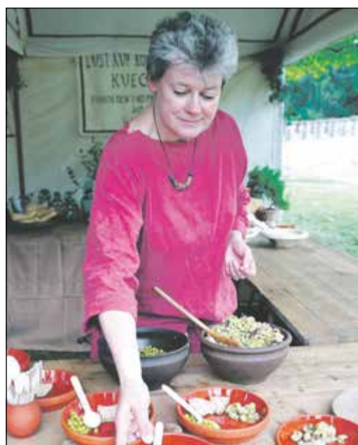
Die römische Küche kannte ein Vielzahl an Gerichten.

Wer mit der römischen Küche vertraut ist, kennt natürlich „Moretum“, einen Frischkäse mit vielen Kräutern oder „Puls“, den römischen Getreideintopf. In diesem Jahr soll der zeitlichen Horizont erweitert und der Blick auch auf die Epochen vor und nach den Römern gelenkt werden: Woher stammen die frühesten Nachweise für das Bierbrauen, wie kocht man eigentlich ohne Kochgeschirr in einer Kochgrube und welche Rezepte für Krapfen und andere Leckereien gibt es aus dem Mittelalter? Welche Zutaten in dieser Zeit allgemein geläufig waren und wie schwierig es ist, Kochrezepte von damals zu entschlüsseln, kann man hier erfahren – und natürlich, ob das Ganze auch schmeckt. Die römische Küche ist selbstverständlich auch in vieler-