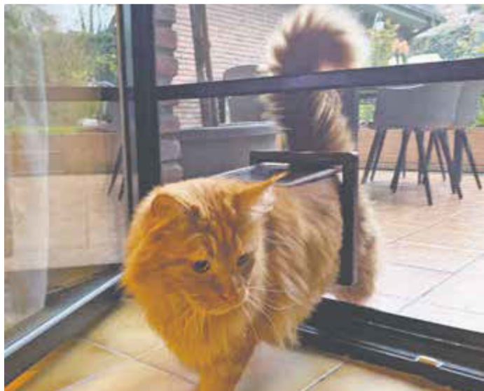
Freier Zugang für Hund und Katze: Mit integrierten Haustierklappen können Mensch und Tier den Sommer ganz entspannt genießen.

(epr) Für alle, die ihren Außenbereich zu jeder Jahreszeit optimal nutzen möchten, sind FLEDMEX® Lamellendächer von Allwetterdach ESCO eine ideale Wahl. Die modernen und vielseitigen Konstruktionen bieten Schutz vor Sonne, Regen, Schnee und Wind und verwandeln Balkon, Terrasse, Garten oder Poolbereich in eine wahre Oase der Entspannung und des Komforts. Sie sind nicht nur flexibel, formschön und funktional – dank der „made in Germany“-Fertigung im hauseigenen Werk kann der Hersteller auch flexibel auf indi-