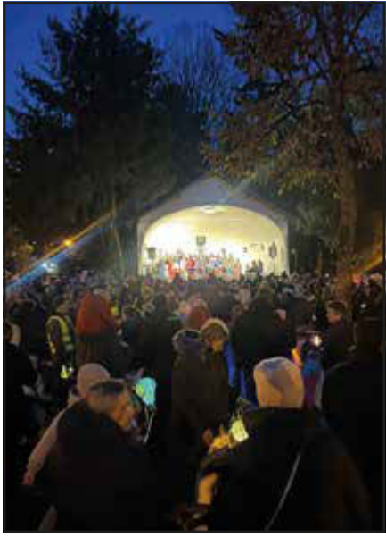
Stimmungsvoller Zwischenstopp an der Konzertmuschel

Bad Soden (bs) – Am Samstag, 11. November, gab es erstmals einen ökumenischer Martinszug in Bad Soden, der viele Kinder und erwachsene Begleiter anlockte. Treffpunkt war der Quellenpark vor der evangelischen Kirche. Nach einer kurzen Begrüßung setzte sich der Laternenumzug in Bewegung.