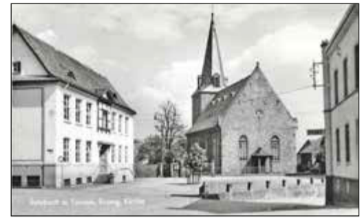
Der Platz an der Linde auf einer historischen Postkarte, als das heutige Bürgerhaus noch Schulhaus (im Bild li.) war.

In der Bekanntmachung der Gemeinde ist neben der Begründung der Antragsteller des Bürgerentscheids auch die Auffassung des