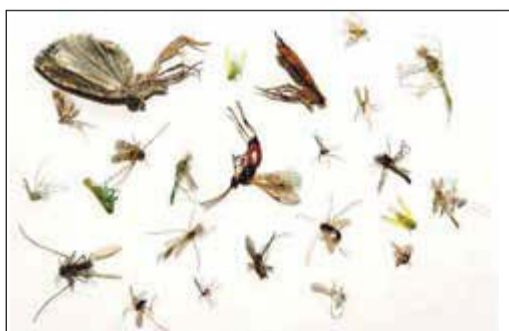
Angelockt: tote Insekten unter einer Laterne

Mehr und mehr Menschen spüren die Auswirkungen von künstlich aufgehellten Nächten deutlich und reagieren mit unruhigem Schlaf und Übergewicht bis hin zu Depressionen und Herz-Kreislauf-Erkrankungen. Menschen