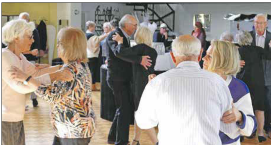
Immer wieder freitags: Tanzprojekt für Menschen mit und ohne Demenz in der Tanzschule Pelzer in Bad Soden

Bad Soden (bs) – Das Tanzprojekt der Senioren- und Demenzarbeit der Evangelischen Andreasgemeinde Niederhöchstadt, das sich an Menschen mit und ohne Demenz richtet, geht weiter. „Am Freitag, 8. Dezember, tanzen