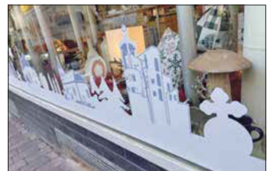
An der weißen Banderole mit markanten Silhouetten in den Schaufenstern ist zu erkennen, wo Weihnachtsgütern und auch Tannenbäumchen gezählt werden können.

Für Familien und besonders die Kinder ist es ein großer Spaß, wenn sie bei einem vorweihnachtlichen Bummel in der Stadt die in den Schaufenstern der Geschäfte versteckten Weihnachtsgütern des Gewerbevereins und Tannenbäumchen aufspüren. In allen Schaufenstern finden sich die goldfarbenen Weihnachtsgütern des Gewerbevereins, in bestimmten Schaufenstern auch Stücke des Bad Sodener Spielteppichs, auf dem kleine Plastikbäumchen stehen. Die Aufgabe der Kinder ist es, Kugeln und Bäumchen zu zählen und diese auf einer Laufkarte einzutragen, die von der städtischen Webseite heruntergeladen werden kann. Dort