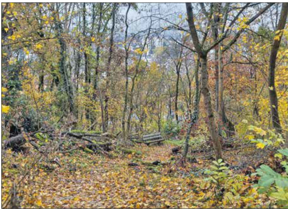
Sieht schön aus, doch der Weg durch das Kastanienwäldchen ist nicht sicher: Blick von der Paulinenstraße auf die Innenstadt.

Bad Soden (bs) – Die meisten Bad Soderer werden den Weg überhaupt nicht kennen: ein breit getretener Pfad durch das Kastanienwäldchen als Abkürzung zwischen der Paulinenstraße und der oberen Dachbergstraße. Weil sich der Weg in einem schlechten Zustand befindet, musste die Stadt entscheiden: ausbauen oder sperren. Wegen der hohen Kosten wird der Weg nun zugemacht.