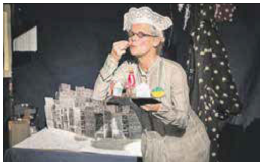
Figurentheater für Kinder im Bürgerhaus Neuenhain: Die Schneeforscherin Atti Olson entdeckt in ihrer Schneeflockensammlung ein kleines Rentier.

Bad Soden (bs) – Der Besuch eines Kindertheaterstücks gehört zur Vorweihnachtszeit: Für Mittwoch, 29. November, um 15 Uhr lädt die Stadt Bad Soden zu dem Figurentheaterstück „Ein Rentier sucht Weihnachten“ ins Bürgerhaus Neuenhain (Hauptstraße 45) ein. Geeignet ist diese poetische Weihnachtsgeschichte nach dem Buch von Christian Seltmann für Kinder ab vier Jahren. Aus dem Inhalt: Die Schneeforscherin Atti Olson ist auf Forschungsreise und zeigt dem Publikum begeistert ihre Schneeflockensammlung. Da entdeckt sie in ihrem Schneeflockenvergrößerungsapparat ein kleines Rentier: Ralf Rüdiger. Dieses Rentier kann nur aus ihrem Buch gefallen sein und so begleiten wir Ralf Rüdiger auf seiner Suche nach Weihnachten. Die Tageskasse öffnet um 14.30 Uhr. Kinder zahlen einen, Erwachsene drei Euro Eintritt.