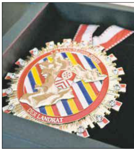
So sieht der Karneval-Ehrenorden des Main-Taunus-Kreises aus.

Gestaltet wurde das Programm mit Beiträgen des Brass & Drum Corps vom Krifteler Karneval Klub, den Tänzerinnen und Tänzern vom Marxheimer Carnival Verein 1949, vom TG Schierstein, den TCC-Pinguinen Schwalbach, der Karnevalsgesellschaft 1900 Hofheim und der Eschborner Käufern. Moderiert wurde der Empfang von Hans-Joachim Greb