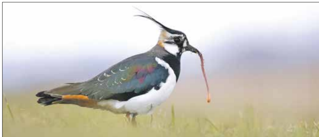
Kiebitz mit Regenwurm: Fast 120.000 Menschen haben sich an der Wahl zum Vogel des Jahres beteiligt.

Beeindruckend sind die Flugmanöver von Kiebitzen zur Balzzeit: Die „Gaukler der Lüfte“ drehen Schleifen über ihrem Revier, stürzen sich in akrobatischen Flugmanövern gen Boden und singen dabei weit hörbar. Die Kiebitz-Männchen versuchen ihre Auserwählte außerdem mit sogenanntem „Schein-nisten“ von ihren Nestbau-Qualitäten zu überzeugen: Sie scharren kleine Mulden in den Boden und rupfen Gräser.