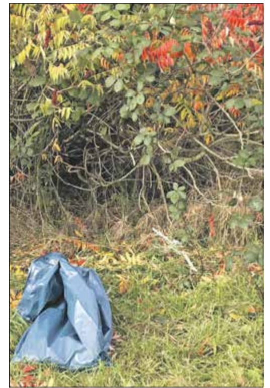
Sauberhaftes Hessen: Am Samstag gibt es eine Müllsammelaktion.

Treffpunkt für die Veranstaltung ist das Waldhaus im Arboretum Main-Taunus, Am Weißen Stein, 65824 Schwalbach.