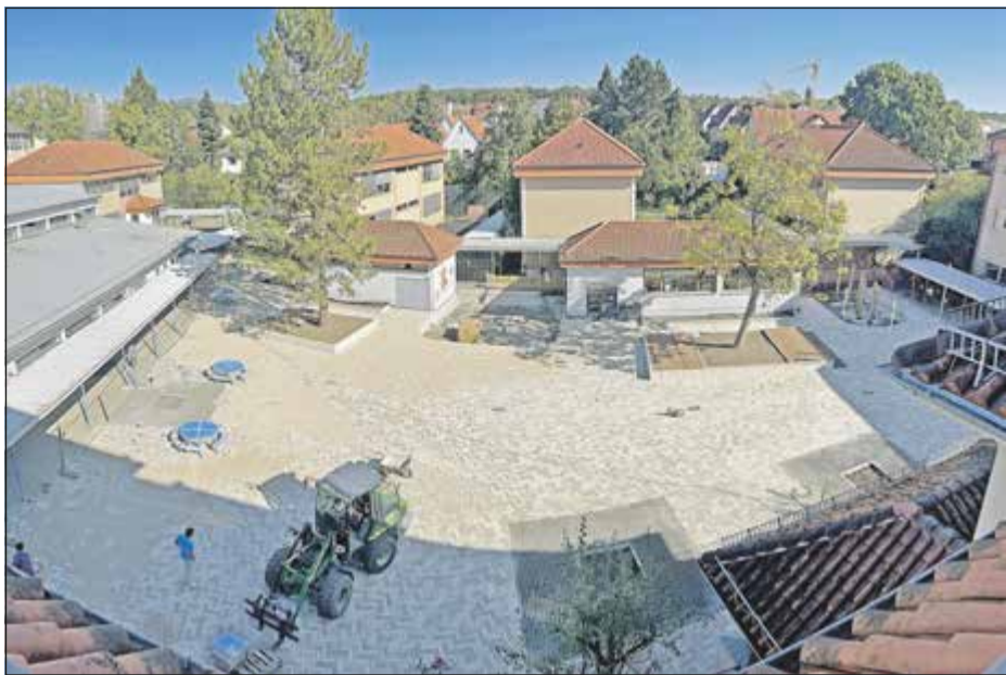
Vor der Fertigstellung: Die Theodor-Heuss-Schule in Bad Soden bekommt einen komplett erneuerten Schulhof.