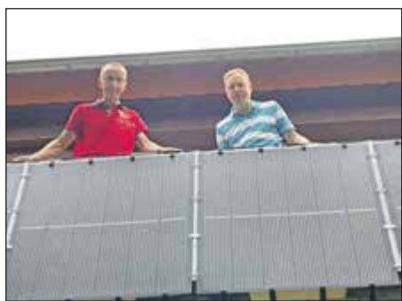
Solarmodule am Balkon: Um solche Anlagen geht es bei der Bürgersolarberatung, die der Verein Klimabewusstes Bad Soden anbieten will.

Bürgermeister Frank Blasch sagt dazu: „Keine andere Technologie verspricht vor Ort so viel Potenzial und ist gleichzeitig universell auch für die Sektoren Wärme und Verkehr einsetzbar. Die aktuell steigende Zahl der installierten Anlagen zeigt, dass viele Bürgerinnen und Bürger ebenfalls auf Strom aus eigener Produktion setzen.“