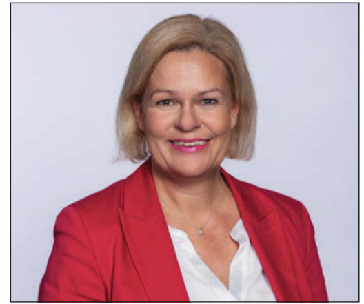
Abgestraft auch im Wahlkreis: Nancy Faeser

Die Parteien, die in Berlin regieren, wurden bei der Hessen-Wahl allesamt abgestraft. Offenbar fehlt das Vertrauen in die Kompetenz, dass sie die derzeit drängenden Probleme lösen werden. Das gilt auch und besonders für die hessische SPD-Spitzenkandidatin Nancy Faeser, die Innenministerin der Berliner Bundesregierung. Sie war auch Kandidatin ihrer Partei im Wahlkreis 32 (Main-Taunus I), zu dem auch Bad Soden und Sulzbach gehören. Statt eines Ministerinnen-Amtsbonus trat das Gegenteil ein: Mit einem Erststimmenergebnis von 14,8 Prozent lag sie sogar noch unter dem hessenweiten 15,1 Prozent für die SPD bei den Landesstimmen. Den Wahlkreis