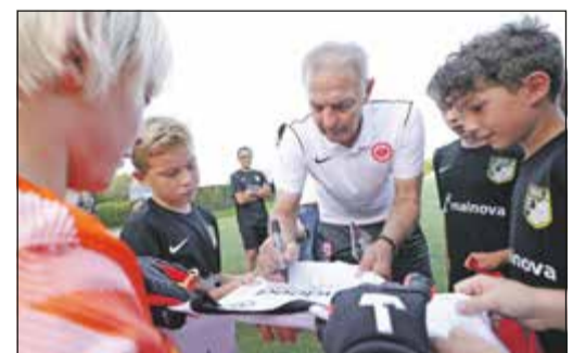
Neue Trikots, neue Autogramme

Für lediglich 119 Euro erhalten die Vereine einen vollständigen Mannschaftssatz inklusive Veredelung mit Vereinsnamen und Nummer. Dieser Eigenbetrag entspricht nur rund 15 Prozent des regulären Verkaufspreises – den Rest übernimmt Mainova. Der Nachwuchs profitiert dabei besonders: Von den 500 verlostem Trikot-Sätzen gehen mehr als die Hälfte an Jugendmannschaften.