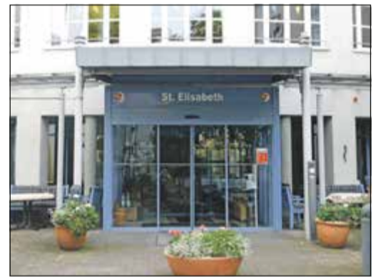
Der Eingangsbereich des heutigen Alten- und Pflegeheims