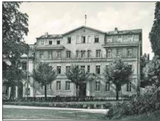
Historisches Foto: St. Elisabeth in Bad Soden als Kinderkurheim