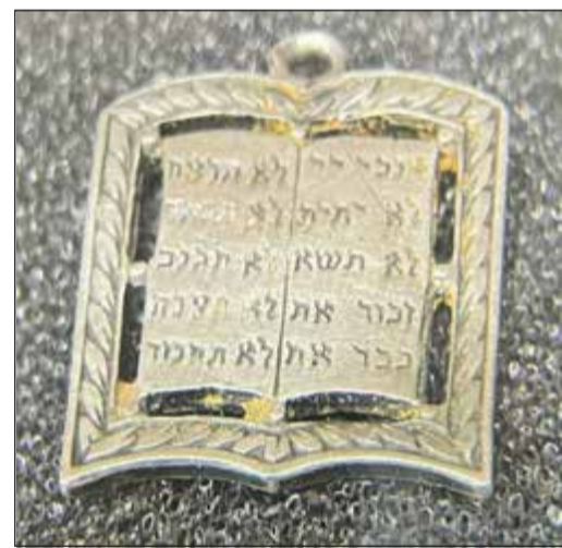
Dieses Schutzamulett, gefunden auf dem Jüdischen Friedhof in Bad Soden, ist das Museumsstück des Monats Oktober im Stadtmuseum.

Auf dem Jüdischen Friedhof in Bad Soden, der trotz der Zerstörungen durch die Nationalsozialisten im Eingangsbereich – vor allem der Leichenhalle – erhalten blieb, fand die erste