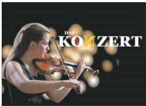
Zum Auftakt der Mendelssohn Tage 2023 ist die Filmkomödie „Das Konzert“ zu sehen.

Bad Soden (bs) – Der Vorverkauf für die 18. Mendelssohn Tage der Musik läuft auf Hochtouren. Wer keines der musikalischen Glanzlichter versäumen möchte, sollte sich rechtzeitig eine der begehrten Karten sichern. Eine rasante Komödie im Kino CasaBlanca mit tragischem Hintergrund und wunderbarer Musik bildet den Auftakt für das Mendelssohn-Festival.