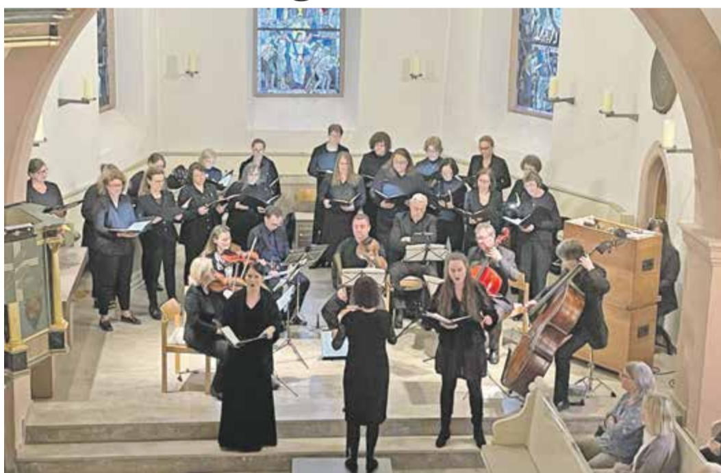
Der Frauenchor der Kirchengemeinde und das Barockensemble „Ensemble Cordis“ beim gemeinsamen Auftritt.

Bad Soden (es) – Friede auf Erden und Herrlichkeit im Himmel: Vivaldis „Gloria“ erklang in der vollbesetzten evangelischen Kirche in Bad Soden, aufgeführt vom Frauenchor der Gemeinde unter Leitung von Kantorin Capucine Payon. Bestens einstudiert, zeigten die 20 Sängerinnen ein beachtliches Klangvolumen, das mit dem kleinen, feinen Barockorchester „Ensemble Cordis“ unter der Leitung von Konzertmeisterin Cornelia Lukas ausgewogen harmonierte.