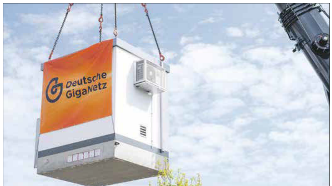
Das Glasfasernetz wird ausgebaut. Dazu werden auch Verteilstationen installiert.