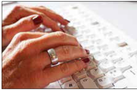
Die Weiterbildungsreihe des Kreises umfasst mehr als zwanzig Angebote.

Gestartet wurde mit einer Jobbörse für Alleinerziehende, bei der sich die Teilnehmerinnen über aktuelle Angebote informieren können, die speziell auf ihre Bedürfnisse zugeschnitten sind. Das Programm endet mit einem Online-Workshop im Januar unter dem Titel „Wie bewerbe ich mich auf LinkedIn?“. Zur Palette gehört neben Informationsveranstaltungen auch persönliche Bera-