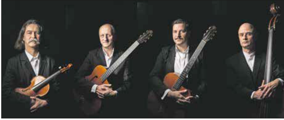
Vier Musiker aus Leipzig spielen auf.