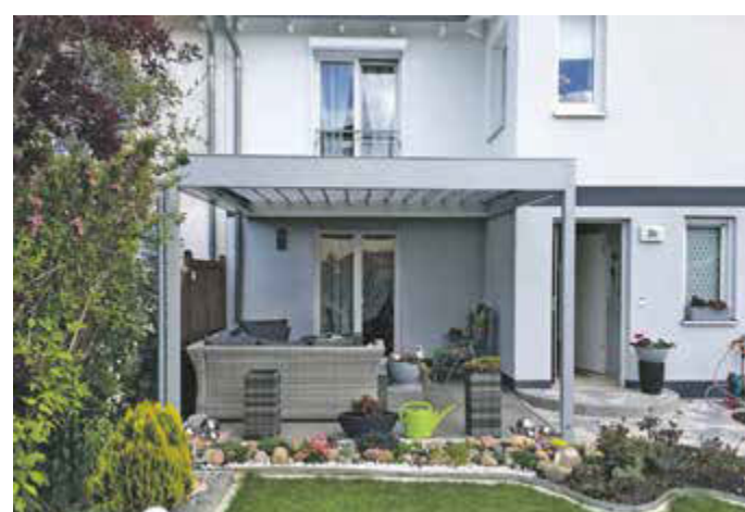
Ein FLEDME ® Lamellendach passt immer, egal ob Dachterrasse, kleiner Balkon oder großer Sommergarten. Möglich wird diese Flexibilität durch die haus-eigene Fertigung, dank der die Systeme stets passgenau auf individuelle Kundenwünsche zugeschnitten werden können.

(epr) Für alle, die ihren Außenbereich zu je(epr) FLEDME ® Lamellendächern von Allwetterdach ESCO bieten zuverlässig Schutz vor Sonne, Schnee, Regen und Wind und schaffen (Frei-)Räume für pure Lebensqualität. Die flexiblen, formschönen und funktionalen „made in Germany“-Systeme passen sich jeder individuellen Gegebenheit an, egal ob Sommergarten, Poolanlage, kleiner Balkon oder große Terrasse, ob Sondermaße, Ecken und Kanten oder geschwungene Formen. Neben dem FLEDME ® Standard mit innovativer Variodach-Technik verleiht z. B. das moderne Design des bestens isolierten FLEDME ® De Luxe dem Zuhause einen zeitgemäßen und eleganten Charakter. Die teiltransparenten Thermolamellen sorgen stets für ausreichend Helligkeit, wobei das absolut blendfreie Licht sogar bis in angrenzende Räume vordringen kann. Bei beiden Modellen schützen die verstellbaren Lamellen in geschlossenem Zustand vor Witterung und UV-Belastung, während sie bei Schrägstellung eine angenehme Luftzirkulation sowie eine optimale Entwässerung und Selbstreinigung ermöglichen. Die Tragkonstruktion ist im persönlichen Wunschfarbton wählbar. Mehr unter www.fledmex.com .