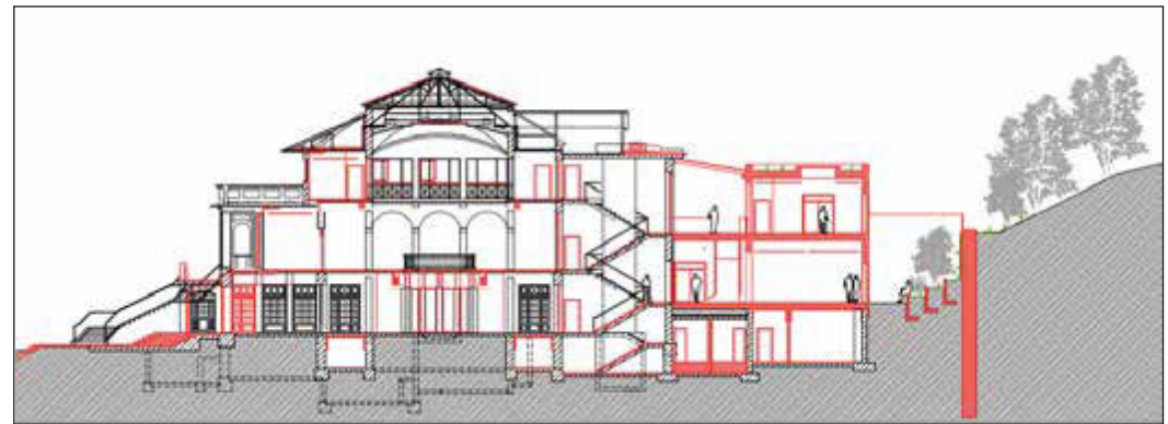
Das Gebäude im Schnitt: rechts der zum Hang hin gelegene Anbau

„Im Ergebnis“, erläutert Blasch, „ist es möglich, auch die Neuenhainer Verwaltungsteile in den Verwaltungscampus Alter Kurpark zu integrieren, allerdings nicht ohne einen zusätzlichen, kleinen Anbau an das Medico-Palais.“ Der Anbau soll auf der hinteren, dem Eingang abgewandten Seite des Gebäudes entstehen. Bei Integration der Neuenhainer Verwaltungsteile in den neuen Verwaltungscampus könnten