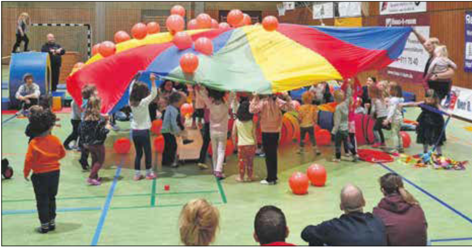
Die Kinder enthüllen die neuen Spielgeräte.