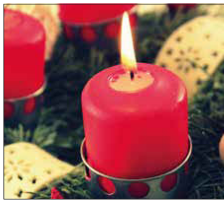
Gemeinsam innehalten

Bad Soden (bs) – Evangelische und katholische Christinnen und Christen möchten auch in diesem Jahr im Monat Dezember zum lebendigen Adventskalender einladen. Alle, die mitmachen, laden zu einem abendlichen Treffen um 18 Uhr vor ihrem Wohnhaus ein. Eine adventliche Geschichte oder ein Gedicht werden vorgelesen und auch ein bis zwei Adventslieder gesungen. Dann ist Zeit zum gemütlichen Gespräch bei Getränken und Snacks. Auf diese Weise wird die Adventszeit zu einem Ort gelebten Miteinanders in der Stadt. „Mir gefällt es einfach, bei so einem Treffen die Hek-