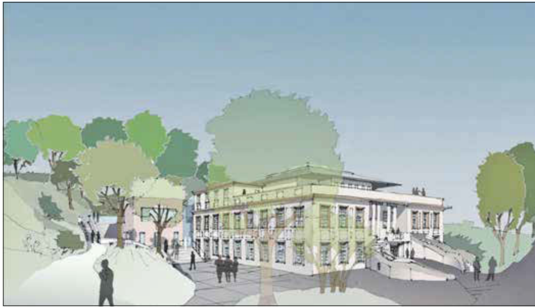
So soll das runderneuerte Medico-Palais in der Vorderansicht aussehen

Grafiken: Architekten Eßmann, Gärtner, Nieper