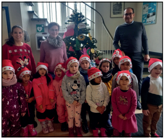
Die Vierjährigen der Kita „Am Hübenbusch“ bei Bürgermeister Blasch