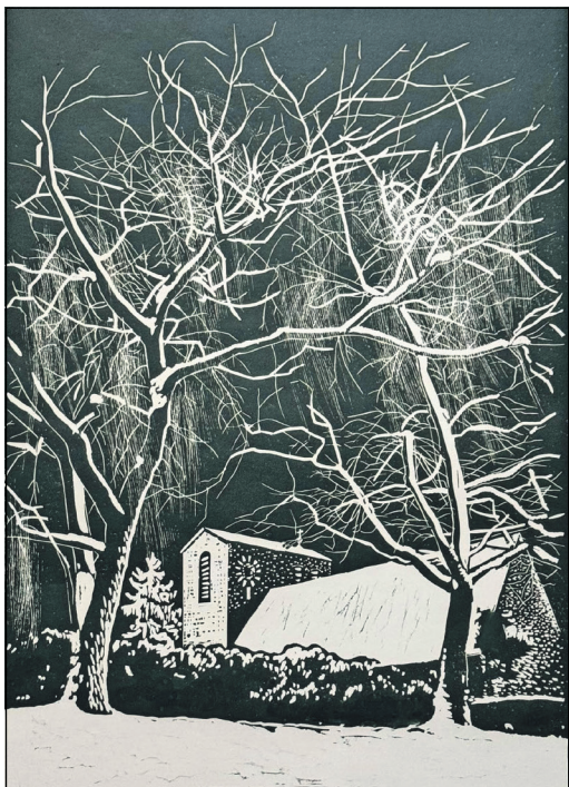
Die Darstellung der Altenhainer Kirche von Rudolph Schucht stammt aus dem Jahr 1981.