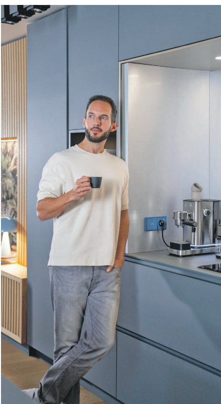
Die JUNG HOME SCHUKO® Steckdose Energy ist schaltbar und misst den Stromverbrauch angeschlossener Geräte.