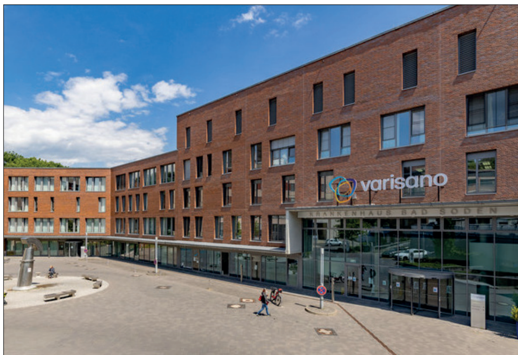
Das varisano-Krankenhaus in Bad Soden: Die Notaufnahme bleibt erhalten, jedoch wird die Notaufnahme des Hofheimer Krankenhauses geschlossen. Dann heißt es für Patienten von dort, den Weg nach Bad Soden oder nach Frankfurt-Höchst zu nehmen.

Die bisher sowohl in Höchst als auch in Bad Soden vorgehaltene Urologie wird schwerpunktmäßig in Bad Soden konzen-