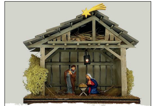
„Der Stall von Bethlehem“: Eine Krippe von Michael Behrle

„Es kann mit relativ wenig Geld sehr viel Nutzen gestiftet werden“, sagt er, dessen Mutter im Alter von 70 Jahren erblindet ist.