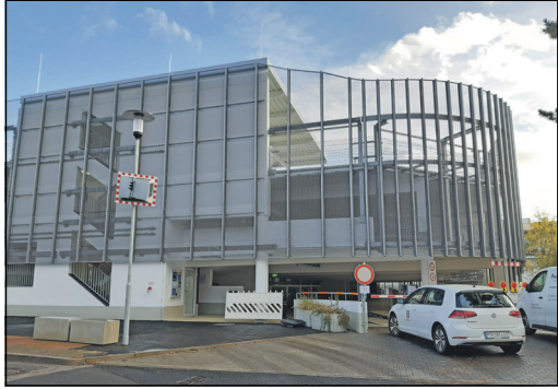
Guter Ausgangspunkt für das Adventsshopping: das Parkhaus am Bahnhof