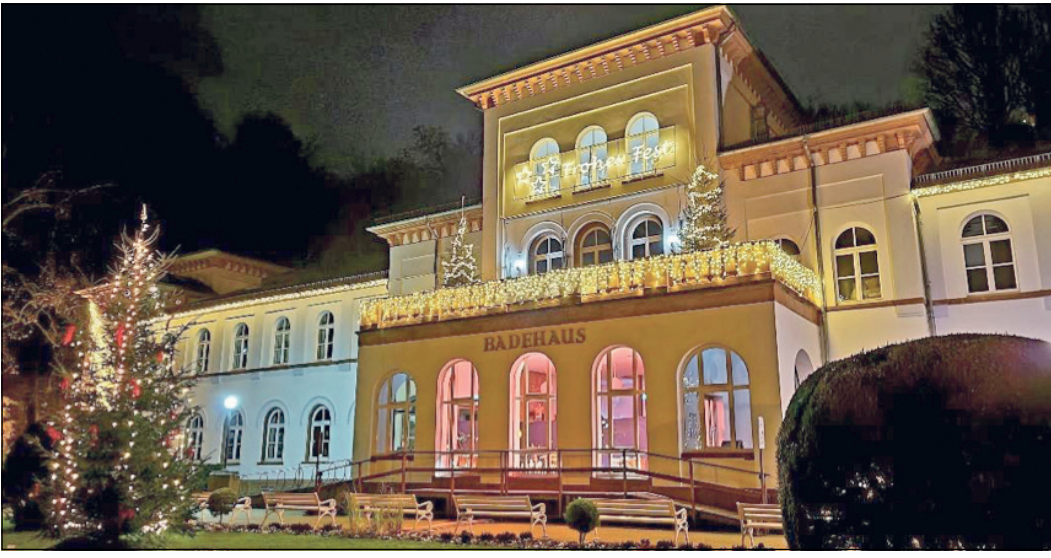
Das erleuchtete Badehaus: Am zweiten Dezember-Wochenende findet im Alten Kurpark der Bad Sodener Weihnachtsmarkt statt, der über die Stadtgrenzen hinaus beliebt ist.

Bad Soden (bs) – Seitdem die Weihnachtsbeleuchtung angeknipst ist, hat für viele die Vorfreude auf Weihnachten begonnen. Am Montag, 27. November, war es so weit, nachdem die Mitarbeiterinnen und Mitarbeiter des städtischen Bau- und Betriebshofs die Leucht-kugeln und Lichterketten in den Bäumen und an den Straßenlaternen angebracht hatten. Ebenfalls erstrahlen auch wieder das Badehaus, die Konzertmuschel und das Paulinenschlößchen. Die Lichterketten und Leuchtobjekte werden vorwiegend mit energiesparenden LED-Lichtern betrieben. Ganz besonders stimmungsvoll ist die Weihnachtskrippe im Foyer des Badehauses, die auch abends noch durch das Fenster bestaunt werden kann. Erstmals gibt es in diesem Jahr dort auch ein Miniatur-Weihnachtsdorf und ein weihnachtlich bestückter Kaufmannsladen.