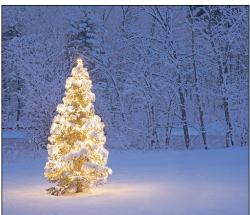
Beleuchtete Winterfichte: Um die Geschichte des Weihnachtsbaums geht es bei einem Abend im Arboretum.

Main-Taunus-Kreis (bs) – Um die Geschichte des Weihnachtsbaumes geht es bei einem vorweihnachtlich-besinnlichen Abend am Mittwoch, 13. Dezember, im Waldhaus im Arboretum Main-Taunus (Beginn: 18 Uhr). Weihnachten mit Baum – warum und seit wann ist das so? Fortswirtin Katrin Reichel beantwortet nicht nur diese Frage, sondern geht auch darauf ein, welche Baumarten als Weihnachtsbaum dienen und gedient haben, welch unterschiedlicher Schmuck in Mode gewesen ist und den Zeitgeist zeigt. Auch die Form der Feier hat sich im Lauf der Zeit geändert. Heute ist der Weihnachtsbaum weltweit bekannt: Wie kam es dazu? Und wie hat man sich geholfen, wenn kein Baum zu bekommen war? Vorgetragen werden dazu Texte von Liselotte von der Pfalz, Johann Wolfgang von Goethe, Peter Rosegger, E. T. A. Hoffmann, Thomas Mann und anderen. Die Teilnahmegebühr beträgt fünf Euro für Erwachsene und zwei Euro für Kinder. Ort: Waldhaus, Am Weißen Stein, 65824 Schwalbach am Taunus.