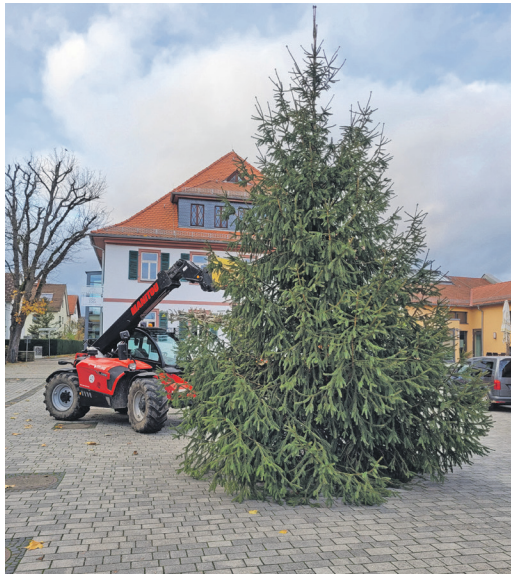
Am Sulzbacher Bürgerzentrum: Die Tanne wird aufgestellt.