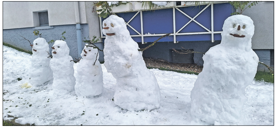
Eine Familie aus Schnee: Was für Kinder ein Vergnügen ist, war für viele Verkehrsteilnehmer vor allem in der vergangenen Woche mit unschönen Erfahrungen verbunden – lange Wartezeiten auf nicht eintreffende Busse inklusive.

Während die Stromausfälle in Hofheim in der Nacht zum 28. November behoben werden konnten, sorgte es für Unmut bei Verkehrsteilnehmern, dass auch an den Folgetagen Sperrmaßnahmen nicht aufgehoben werden konnten. Lange beeinträchtigt blieb der Busverkehr, stundenlanges Warten inklusive. Die Information der Fahrgäste war unzureichend. So teilte der Rhein-Main-Verkehrsverbund (RMV) zum Busverkehr in der Region lapi-