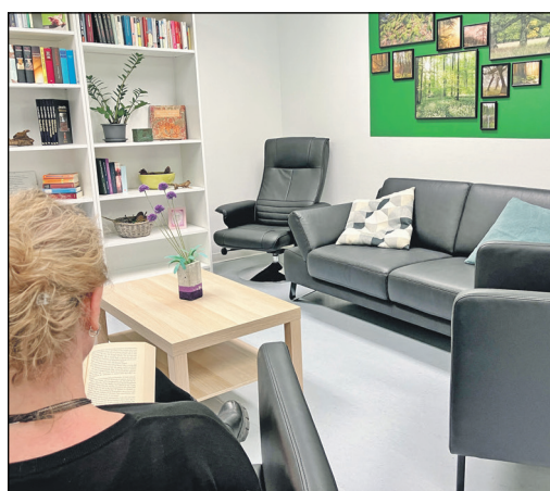
Im Gemeinschaftsraum der neuen psychiatrischen Tagesklinik im Hofheimer Krankenhaus können Patienten lesen, sich austauschen oder entspannen.

Main-Taunus-Kreis (bs) – Die psychiatrische Institutsambulanz und die psychiatrische Tagesklinik sind aus der Kurhausstraße in Hofheim an das Krankenhaus Hofheim umgezogen. Die Tagesklinik befindet sich