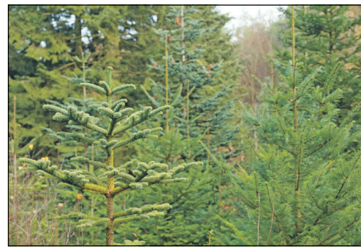
Tannen und Fichten werden als Weihnachtsbäume verkauft.

tanne). Am 16. und 17. Dezember findet ein Weihnachtsmarkt am Naturfreundehaus statt. • Samstag, 16. Dezember, 10 bis 16 Uhr: Schmittens Treisberg/Parkplatz am Pferdeskopf (Nordmanntanne, Nobilistanne) • Samstag, 16. Dezember, 10 bis 16 Uhr: