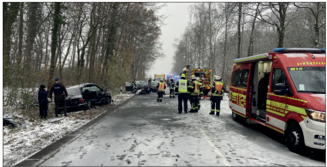
Insgesamt sechs Fahrzeuge waren am Unfallgeschehen beteiligt.

Zudem stieß ein nachfolgender VW mit dem Skoda der 58-Jährigen zusammen. Auch zwei Mercedes-Pkw und ein Toyota konnten nach dem Unfall nicht mehr rechtzeitig bremsen und fuhren auf das jeweils vorausfahrende Auto auf. Alle vier Fahrzeuge waren hinter dem Skoda von Sulzbach in Fahrtrichtung Schwalbach unterwegs gewesen und konnten nach der Kollision nicht mehr rechtzeitig