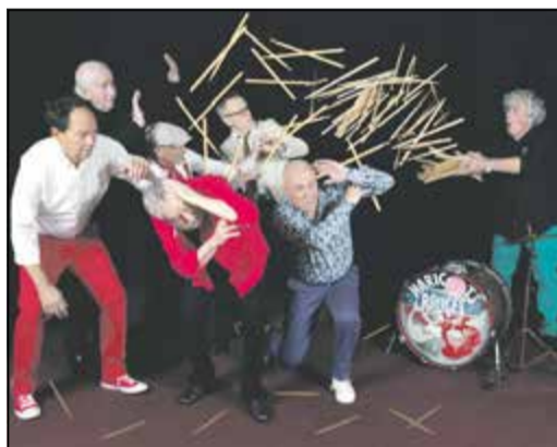
Jazz mit Spaß: Auch die Gruppe „Les Haricots Rouges“ war zu Gast in Bad Soden.