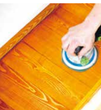
Das lohnt sich! Eine Veredelung von Parkett, Steinzeugfliesen & Co. wappnet Böden für die kleinen Strapazen des Alltags.