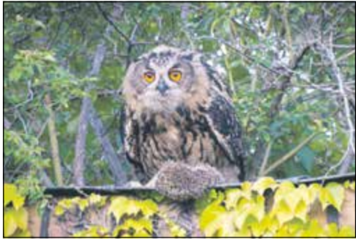
Junger Uhu bei einer Igel-Mahlzeit

Bad Soden (wto) – Im Brutjahr 2023 hat es zwei erfolgreiche Uhubrutten in Bad Soden gegeben. Das teilt Klemens Fischer von der Bad Sodener Ortsgruppe des Naturschutzbundes Deutschland mit. Neben der Uhubrut auf dem Bad Sodener Hundertwasserhaus, die bereits seit 2014 Jahr für Jahr zu beobachten ist, hat es diesmal auch am Steinbruch im Süßen Gründchen eine erfolgreiche Uhubrut gegeben. Während auf