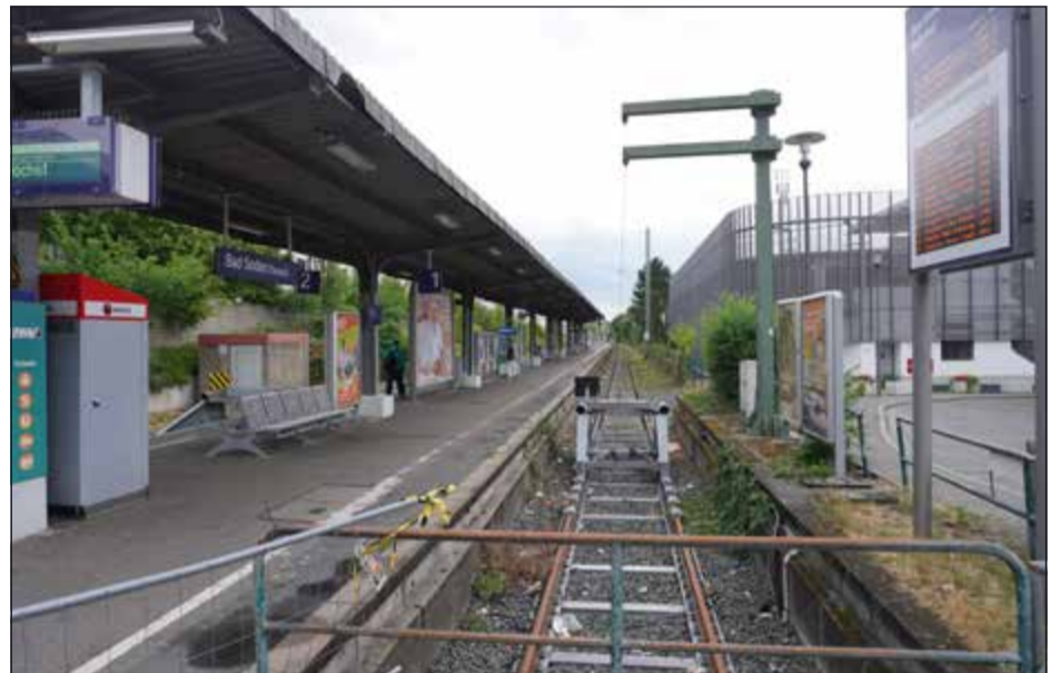
Zuletzt ein häufiger Anblick: Kein Zug auf Gleis 1 in Bad Soden, die Fahrten der RB11 fallen immer wieder aus. Grund sind Personalprobleme beim Betreiber.

Die hundertprozentige DB-Tochter Regionalverkehre Start Deutschland