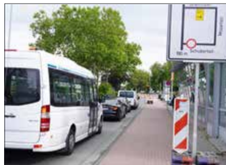
Ein Geduldsspiel: Die Königsteiner Straße in Bad Soden im August

Die Sanierungsarbeiten zwischen dem Main-Taunus-Zentrum und der L3014