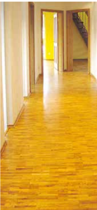
Von farblos über Sandgelb bis zu Doppelweiß: Das Hartwachsöl 290 belebt nicht nur die Struktur, sondern vertieft auch die Tönung von Fußböden oder Treppenstufen.

Untergründe. Es belebt die natürliche Struktur des Fußbodens, vertieft die Tönung und sorgt für eine offenporige, seidenmatte und strapazierfähige sowie wasserabweisende Oberfläche. Zugegeben, die Veredelung eines Fußbodens macht man nicht mal ebenso – der Aufwand lohnt sich aber in jedem Fall: Das Ergebnis mit dem LEINOS Hartwachsöl 290 spricht für sich! Weitere Infos zum Öl und dessen Anwendung gibt es unter www.leinos.de .