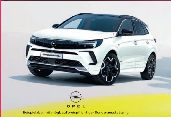
Beispielabb. mit mögl. aufpreispflichtiger Sonderausstattung