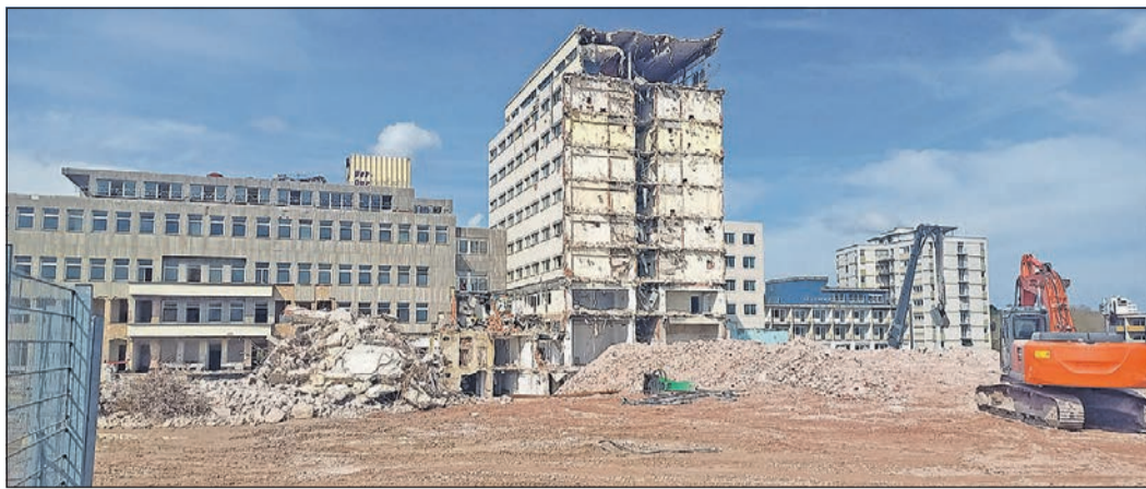
Im April 2023 war schon ein Großteil des alten Krankenhauses verschwunden. Im Zuge der aktuellen Verhandlungen haben sich die Vertragspartner nun darauf geeinigt, dass der Investor die noch stehenden Gebäude bis zum 30. Juni 2024 abreißen wird.