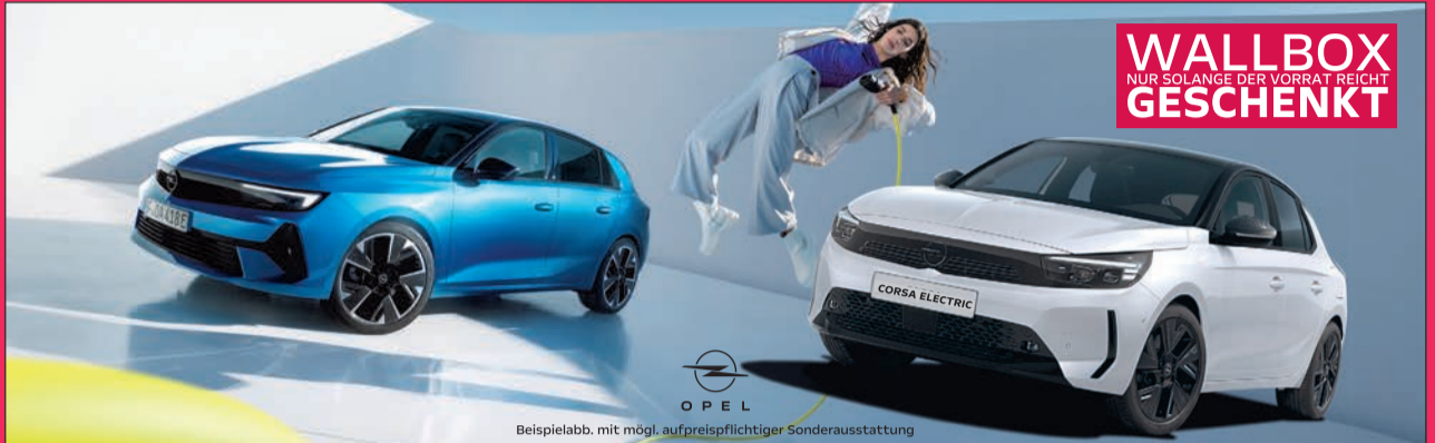
Beispielabb. mit mögl. aufpreispflichtiger Sonderausstattung

* Die tatsächliche Reichweite kann unter Alltagsbedingungen abweichen und ist von verschiedenen Faktoren abhängig, insbesondere von persönlicher Fahrweise, Streckenbeschaffenheit, Außentemperatur, Nutzung von Heizung und Klimaanlage sowie thermischer Vorkonditionierung. ** Die einmalige Leasingsonderzahlung kann eventuell auch der staatliche Umweltbonus sein, der auf Antrag bei Erfüllung der Fördervoraussetzungen gewährt werden kann. Weitere Informationen zum Umweltbonus und zur Antragstellung unter www.bafa.de . 1) Preisvorteil gegenüber der unverbindlichen Preisempfehlung des Herstellers am Tag der Erstzulassung. 2) Laufzeit 24 Monate (Corsa) bzw. 30 Monate (Astra, Grandland), Laufleistung 10.000 km / Jahr zzgl. 1.095,- € Fracht. Ein Leasingangebot der Stellantis Bank S.A., Siemensstraße 10, 63263 Neu-Isenburg, für die der Angebotsleistende als ungebundener Vermittler tätig ist. 3) Nur bei Kauf eines der beworbenen Aktionsmodelle und nur solange Vorrat reicht.