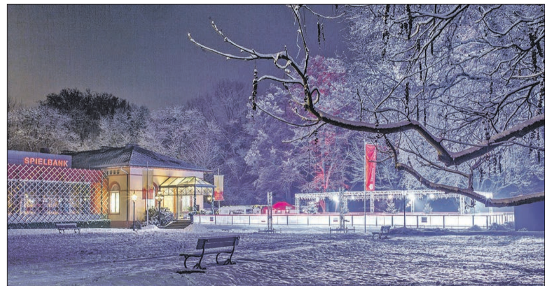
Die Eisbahn in buntes Licht getaucht, Raureif auf den Bäumen und als malerische Kulisse das Kaiser-Wilhelms-Bad: Beim Eiswinter werden die Besucher verzaubert.

Veranstalter des Eiswinters ist die „Stiftung Historischer Kurpark Bad Homburg v. d. Höhe“, der auch ein Teil der Einnahmen zugute kommt. Die Durchführung wird ermöglicht durch die Hauptsponsoren Taunus Sparkasse und Francois-Blanc-Spielbank sowie die langjährigen Sponsoren Comfort Hotel Bad Homburg, Gonder Facility Services GmbH, Stadtwerke Bad Homburg, Süwag Energie AG, David Lloyd Bad Homburg und Kur Royal Aktiv. Weitere Informationen gibt es im Internet unter www.eiswinter-bad-homburg.de .