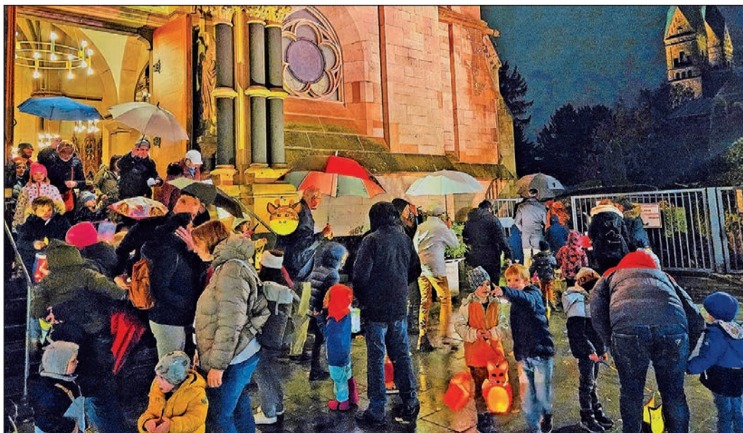
Nach dem kleinen Umzug in der Kirche machen sich alle durch den Regen auf den Weg in die Kita nebenan, um dort weitere schöne Stunden zu verbringen.

Nach mehreren Runden durch die Kirche führte der Weg direkt in die Kita St. Marien neben der Kirche, wo sich die Kinder des Lichtzugs nach und nach hinschlängelten. Dort gab es gegen Spenden Martinssüßigkeiten und Brezeln zu essen, und mit warmen Getränken konnte der Abend noch länger in gemütlicher Gemeinsamkeit genossen werden.