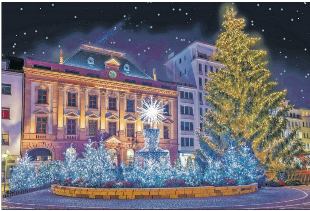
Am Kurhaus erstrahlt rund um den Brunnen der leuchtende Weihnachtswald, und der 18 Meter hohe Weihnachtsbaum „Louise“ darf bestaunt werden.