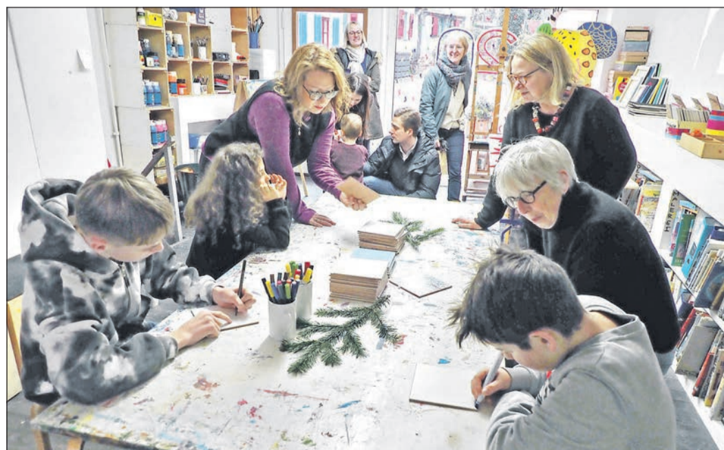
Kinder gestalten ihre Kacheln nach eigenen Entwürfen.

...und wünscht viel Freude beim Einlösen der Gewinne!