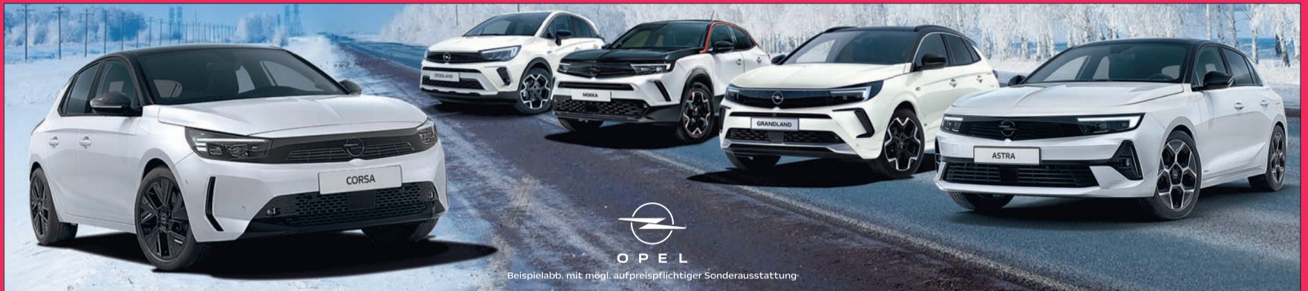
Beispielabb. mit mögl. aufpreispflichtiger Sonderausstattung