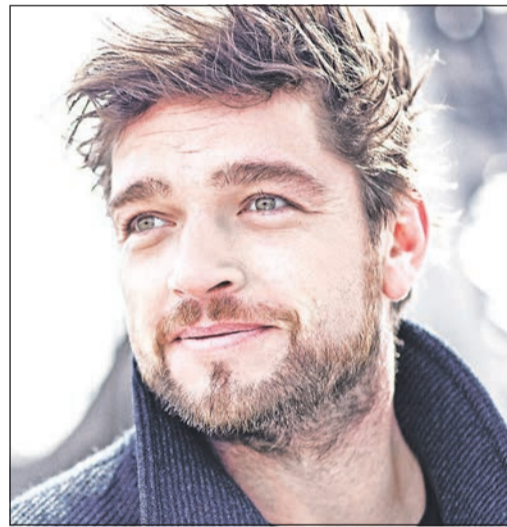
Ronald Zehrfeld, Charakterdarsteller sowie bekannt aus „Babylon Berlin“, liest Franz Kafkas „Die Verwandlung“.