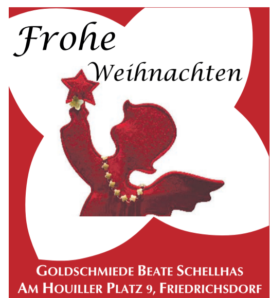
GOLDSCHMIEDE BEATE SCHELLHAS AM HOULLER PLATZ 9, FRIEDRICHSDORF

Bad Homburg (hw). Viele Geheimnisse, Sagen und Geschichten ranken sich um die Tage „zwischen den Jahren“. Am Mittwoch, 20. Dezember, können Interessierte von 19 bis 20.30 Uhr im Frauenbildungszentrum einen Einblick in diese ganz besondere Stimmung der raum- und zeitlosen Phase gewinnen und Ritualen und volkskundlichem Glauben nachspüren. Die Kursgebühr beträgt 16 Euro. Anmeldung und Information im Büro des Frauenbildungszentrums unter Telefon 06172-84188 oder im Internet unter www.frauenbildungszentrum.de .