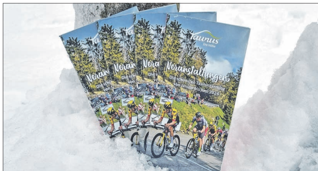
Kompakt und übersichtlich: Im neuen Veranstaltungskalender sind alle Höhepunkte im Taunus aufgelistet.

Ab sofort ist die kompakte Broschüre kostenfrei in der größten Tourist-Info des Taunus im Taunus-Informationszentrum an der Hohepark in Oberursel sowie im gesamten Verbandsgebiet des Taunus Touristik Service in den Tourist-Informationen, Bürger-Büros und Freizeiteinrichtungen der TTS-Mitgliedsorte erhältlich. Zudem sind im Internet unter www.taunus.info alle Veranstaltungen der Freizeitregion Taunus mit vielen weiteren Tipps und atmosphärischen Bildern abrufbar. Das PDF der Broschüre kann dort ebenfalls heruntergeladen sowie als Printexemplar für zu Hause bestellt werden.