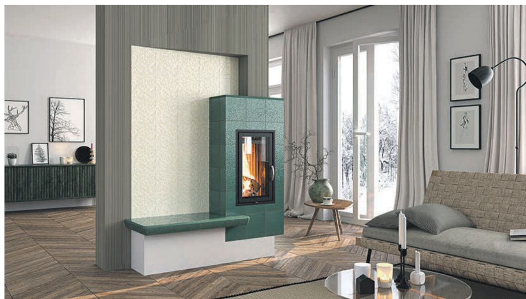
Hybrider Heizkomfort: Der Kachelofen entlastet die Wärmepumpe umweltfreundlich und stromsparend, besonders wenn es sehr kalt ist.

(DJD). Ab 2024 soll möglichst jede im Neubau eingebaute Heizung zu 65 Prozent mit erneuerbaren Energieträgern betrieben werden. Für viele Bauherren ist die naheliegende Lösung eine Wärmepumpe. Sie kommt zudem für die Sanierung von Bestandsgebäuden infrage. Doch sie hat ihre Tücken. Da sie ihre Energie aus der Umwelt gewinnt, heißt dies: Je kälter die Luft, desto mehr Strom ist nötig, um die enthaltene Energie zu nutzen. Wird es im Winter richtig kalt, springt zusätzlich ein Elektroheizstab als Wärmeerzeuger ein, der Stromverbrauch steigt enorm. Die Lösung kann hybrides Heizen sein: Die Wärmepumpe im Duo mit einer modernen Holzfeuerstätte. Darüber kann man sich beim Fachbetrieb informieren, Ofenbauer in der Nähe findet man unter www.kachelofenwelt.de.