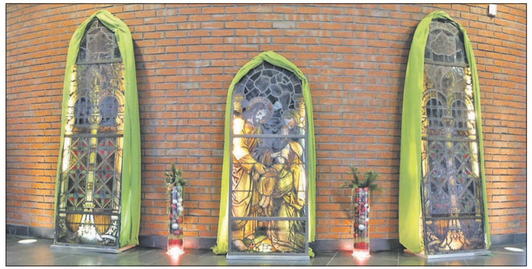
Die historischen Bleiglasfenster aus dem alten Kreis Krankenhaus an der Taunusstraße sind derzeit im Foyer der Hochtaunus-Kliniken in Bad Homburg zu sehen.

All dies habe es bisher im Hochtaunuskreis nicht gegeben. Dies sei ein Erfolg der von der SPD in Zusammenarbeit mit Landrat Ulrich Krebs geprägten Regierungspolitik. „Vor diesem Hintergrund möchten wir in der so wichtigen Funktion des Landrats keine Veränderung und empfehlen Ulrich Krebs für diese Wahl“, so die SPD-Politiker.