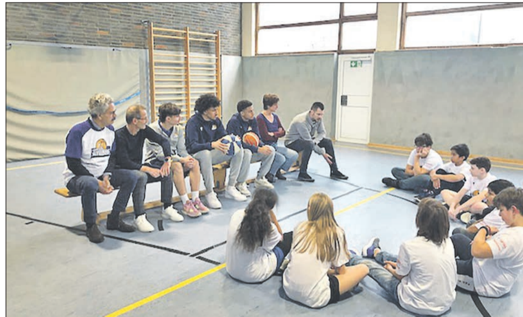
Ganz genau hören die Schüler zu, wenn die Basketball-Profis den einen oder anderen Tipp zur Verbesserung des Spiels weitergeben.

Der Lions Club Bad Homburg wurde offiziell am 6. Mai 1959 gegründet. Aktuell engagieren sich die 48 Mitglieder ehrenamtlich unter dem Motto „Bürger helfen Bürgern“ für das Gemeinwohl und für Menschen in Not. Der Club setzt sich insbesondere für Bedürftige, Kinder und Senioren in der Region ein. Dabei kümmert er sich um eine Vielzahl von Projekten für die Bad Homburger Bürger mit einem starken Fokus auf Bad Homburger Schulen zur Sport- und Gesundheitsförderung sowie Sucht- und Gewaltprävention, Seniorenbetreuung und heilpädagogische Therapien, gemäß dem Leitgedanken von Lions International „We Serve!“.