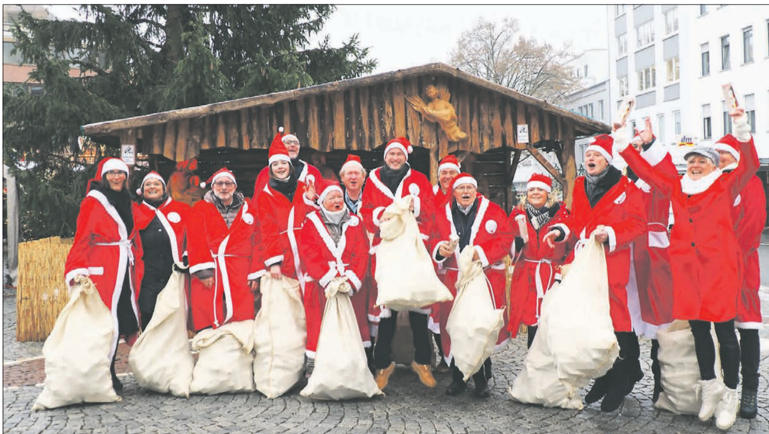
Mit einem kleinen Freudenhüpfer und einem lauten „Hohoho“ starten die Nikoläuse ihre Parade durch die Louisenstraße und verschenken den süßen Inhalt ihrer Jutesäcke.