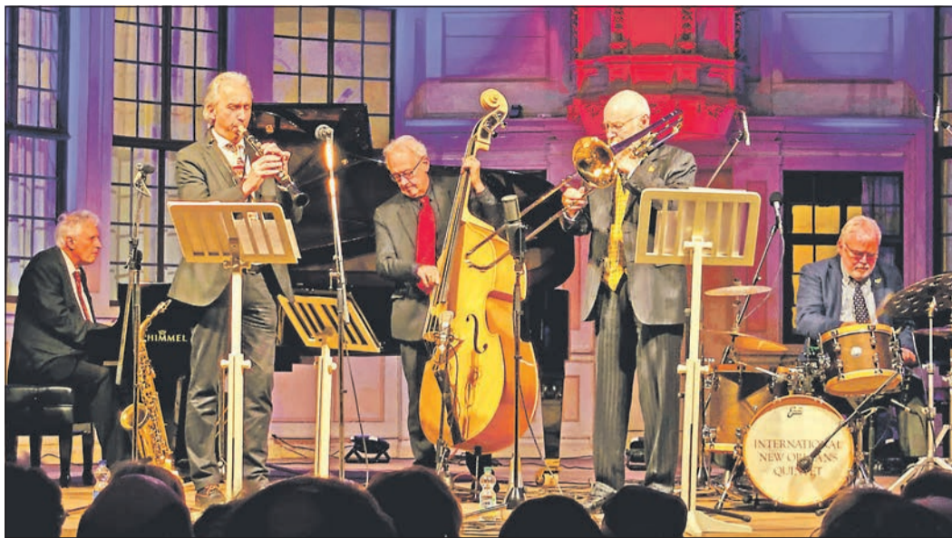
Das „International New Orleans Quintet“ erzeugt in der Schlosskirche eine besonders feierliche Atmosphäre und hat typische New-Orleans-Stücke, aber auch bekannte Weihnachtslieder und Gospels im Repertoire.